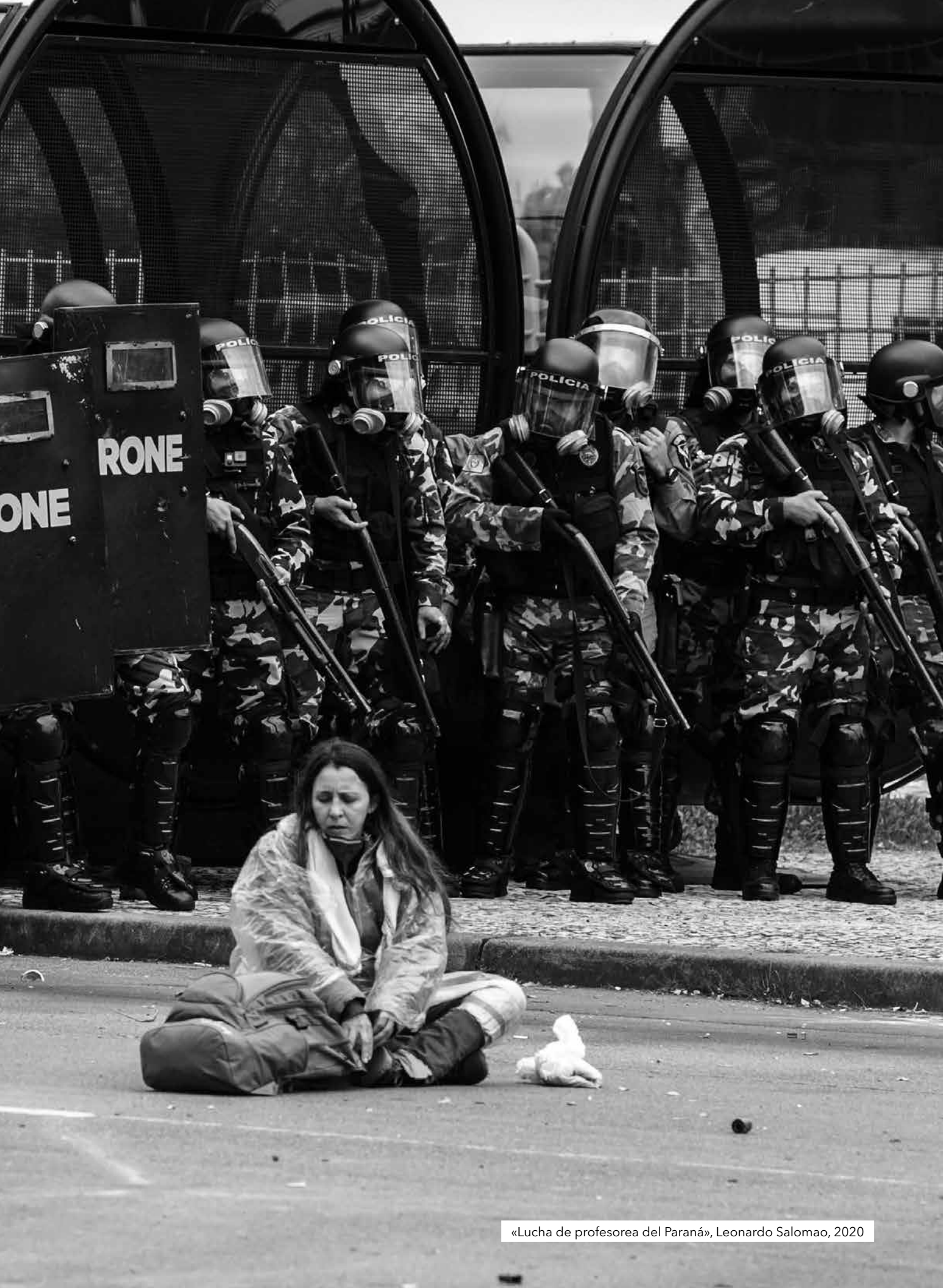
«Lucha de profesorea del Paraná», Leonardo Salomao, 2020