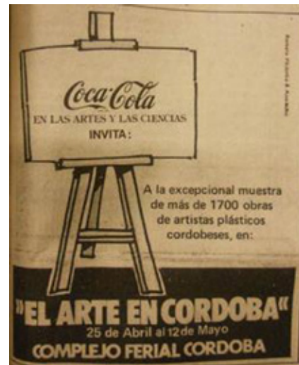
Fig. 2: Propaganda publicada en La Voz del Interior , 25 de abril de 1985, Sección 2, p. 12.