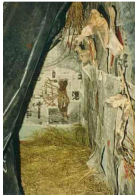
Fig. 12: Anahí Cáceres, Cueva negra , 1985, instalación: óleos sobre lienzo, objetos, pigmentos, técnica mixta: madera, rama, papel, paja. Cúpula Violeta en FAC 1985. Foto disponible en sitio web de la artista: < https://www.arteuna.com/PLASTICA/caceresobras0.htm >. Consulta: 21 de julio, 2019.