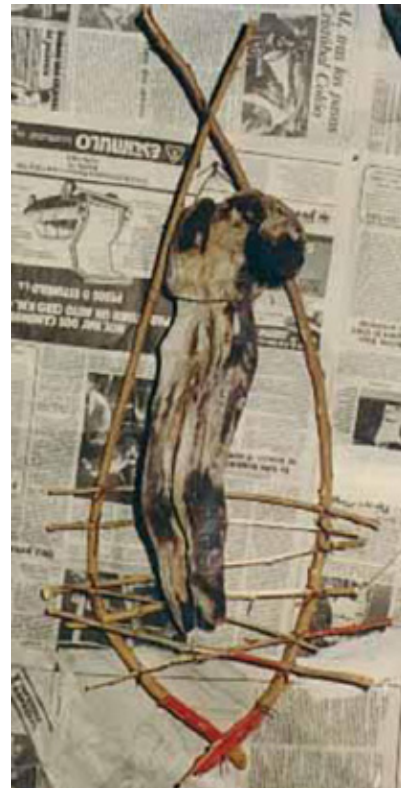
Fig. 13: Anahí Cáceres, Cueva negra , 1985, detalle.