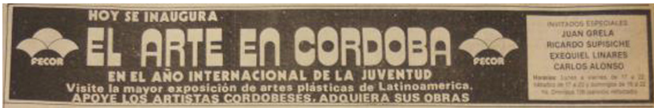
Fig. 3: Propaganda publicada en La Voz del Interior , 25 de abril de 1985, Sección 2, p. 12.

La parte central del foro se dedicó a las deliberaciones sobre “problemas juveniles en comisiones de trabajo” que se reunían en el edificio universitario de Sala de las Américas. Conjuntamente, se diagramaron “actividades complementarias”, culturales y deportivas, que se plasmaron en diferentes puntos de la ciudad, como FECOR. 29