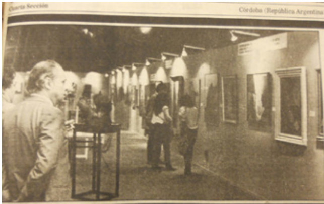
Fig. 5: "El arte en Fecor", La Voz del Interior , 28 de abril de 1985, Sección 4, p. 1.

condicionantes que rigieron la participación de los doscientos artistas publicitados. 47