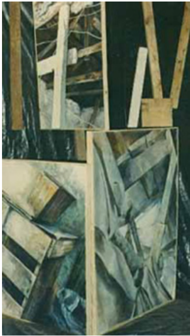
Fig. 14: Anahí Cáceres, Una torre , 1985, instalación. Cúpula Violeta en FAC 1985. Foto disponible en sitio web de la artista: < https://www.arteuna.com/PLASTICA/caceresobras0.htm >. Consulta: 21 de julio, 2019.

12 y 13). 57 El relato sobre su segunda obra (vease fig. 14) verbaliza una búsqueda de traspasar los bordes no solo entre las disciplinas plásticas, el realismo y la abstracción, sino entre la Argentina y uno de sus países limítrofes: “además, puse pinturas al óleo de un viaje que hice a Chile [...] eran pinturas realistas, pero la toma era abstracta. De cosas realistas, yo agarraba un pedacito y las pintaba. Algunos de esos cuadros los puse como una torre de bastidores de pinturas al óleo y palos. Era una instalación [que] estaba al lado de la cueva ”. 58