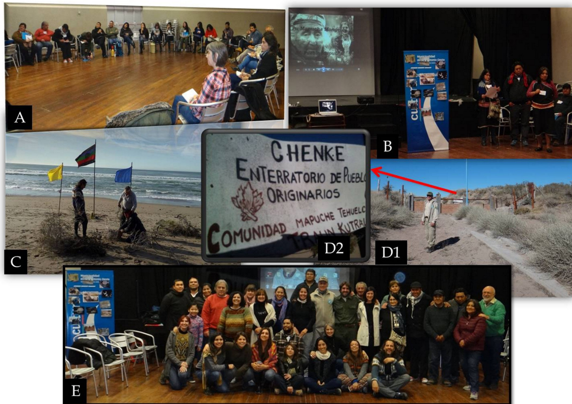
Figura 2. Diferentes momentos durante las actividades desarrolladas en el 1er Taller de Diálogo.

resistencia y recuperación del espacio sagrado que acompañaron con fotografías referidas al hallazgo en el sitio Chenque exhibidas en un banner (etapas de construcción del cercamiento del sitio, ceremonias en el lugar, etc.) junto con la