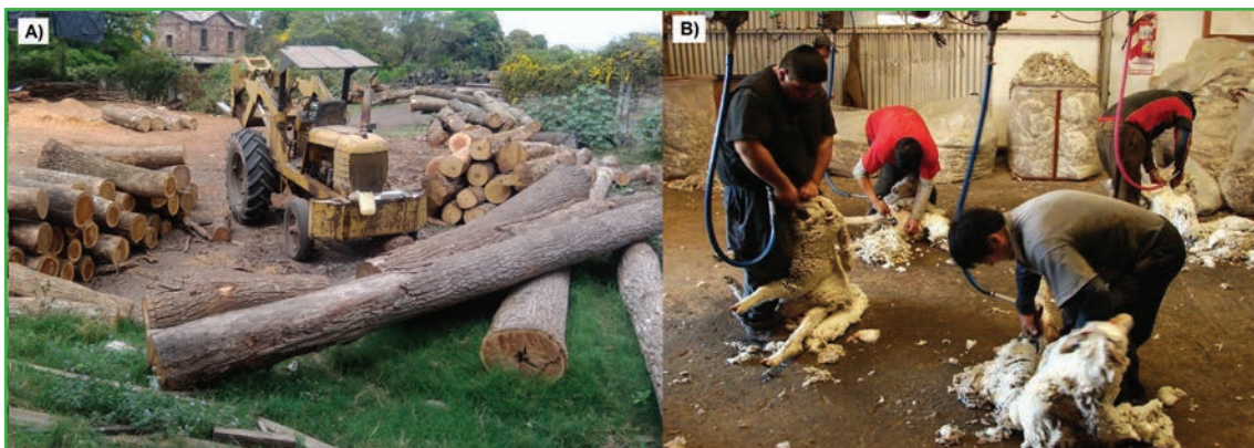
Figura 2: Ejemplos de actividades productivas representativas de norpatagonia. A) Producción forestal cuyo destino puede ser madera redonda, madera industrial o leña. B) Producción ovina cuyo destino puede ser lana, carne o cuero.

En el marco de la Plataforma Temática sobre "Análisis de Ciclo de Vida y Huellas Ambientales" desarrollada en la última cartera de Proyectos de INTA, se han conformado grupos de trabajo en Patagonia Norte para evaluar el impacto ambiental de las actividades productivas regionales (Figura 2). Las producciones ganadera, forestal o frutihortícola en una región de alta naturalidad como lo es el norte de la Patagonia, requieren de una actualización en su enfoque, que contemple las emisiones de carbono y otras huellas en la toma de decisiones. Específicamente, contemplar las nuevas exigencias del consumidor implica comprender y aplicar normativas vigentes e internacionales que consideren todo el proceso productivo. De esta forma se espera evaluar la Huella de Carbono (y otras huellas ambientales) de nuestros principales productos agropecuarios, lo que implicaría por ejemplo, cuantificar los CO 2 equivalente emitidos por cada kg de frutilla, madera, fibra y/o carne (Figura 3).