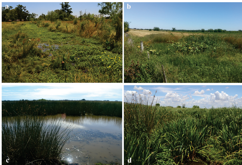
Figura 1. Bañados de desborde fluvial estudiados: a. Del Gato; b. Carnaval; c. Chubichaminí; d. Cajaravillas. Figure 1. Riverine Wetland studied: a. Del Gato; b. Carnaval; c. Chubichaminí; d. Cajaravillas.

Los cuatro BDF seleccionados fueron visitados en marzo del 2020, estableciéndose en cada uno de ellos tres transectas transversales al curso de agua que se ubicaron aguas arriba, aguas abajo y en el bañado propiamente dicho. En cada de estas se reconocieron tres zonas delimitadas a priori: margen derecho (MD), margen izquierdo (MI) y la zona fluvial (ZF). A su vez, en cada una de ellas, se establecieron tres unidades muestrales contiguas de 1 m 2 . Por lo tanto, cada transecta incluyó nueve unidades muestrales, totalizando 27 unidades en cada uno de los cuatro BDF analizados. Las especies se identificaron a partir de floras regionales (Cabrera y Zardini, 1993) con la debida actualización taxonómica de la página de Flora Argentina (2020). En cada unidad muestral, se evaluó la cobertura absoluta de las especies, basada en la escala de Domin-Krajina (Braun-Blanquet, 1979): "1" cobertura hasta de 10% del área de la parcela, "2" cobertura entre el 11 y 20%, "3" cobertura entre > 20 a 40%, "4" cobertura entre > 40 y 60%, "5" cobertura entre > 60 y 80%, y "6" cobertura entre > 80 y 100%.