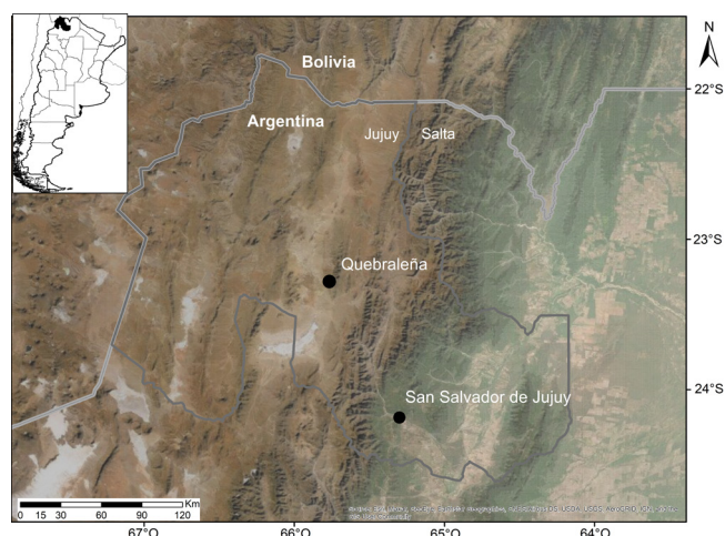
Figura 1. Localización de la provincia de Jujuy en la Argentina (recuadro) y los sitios de estudio (Quebraleña y San Salvador de Jujuy) dentro de la provincia de Jujuy sobre una imagen satelital de espectro visible.

En el presente trabajo se recolectaron semillas y trozos de ramas jóvenes de los árboles de P. tomentella en la localidad de Quebraleña (Cochinoca, Jujuy, Argentina). Se realizaron los ensayos en el invernáculo de la escuela rural N° 381 de Quebraleña y el de la Facultad de Ciencias Agrarias, Universidad Nacional de Jujuy, San Salvador de Jujuy en la provincia de Jujuy (Fig. 1).