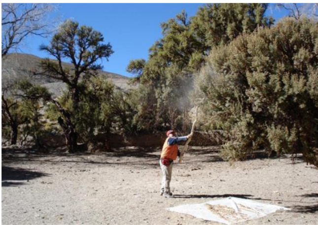
Figura 2. Foto de la técnica de recolección de semillas de P. tomentella en la localidad de Quebraleña, Jujuy, Argentina

Todas las semillas y ramas utilizadas en los ensayos provenían del bosque de Quebraleña. Se eligieron 10 árboles a más de 50 metros entre sí, con las siguientes características: 1. Se evitaron ejemplares aislados; se estimó la cobertura del bosque en un radio de 25 m alrededor del árbol y se eligieron lugares con una cobertura del 10% mínimo. 2. Altura del individuo: 3 o más metros, estimando a ojo la altura desde su base hasta la rama más distante. La recolección de semillas se realizó mensualmente. Con la ayuda un bastón de 3 m de largo se sacudieron las ramas sin dañar en lo posible el follaje para desprender las semillas y recolectándolas en un plástico de 3 x 2 m colocado en el suelo (Fig. 2). Cada vez se colectó una cantidad que aseguraba los ensayos del mes (mínimo de 4.000 por mes). Una vez recolectadas las semillas, éstas se guardaron en bolsas de polietileno, rotuladas, marcando número de árbol y fecha de la colecta.