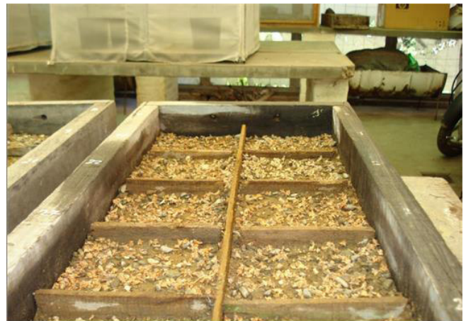
Figura 3. Siembra de semillas de P. tomentella en invernáculo

En los viveros, se realizaron 12 siembras por mes a lo largo del año. Como germinadores se utilizaron cajones de madera de 58x30x12 cm (Fig. 3), y como sustrato tierra de hasta 30 cm de profundidad de Quebraleña. Para cada siembra, se midió la germinación, de manera mensual registrando todos los nacimientos de plántulas hasta que ya no se produjeran más, considerando el nacimiento como la extensión completa de los cotiledones. Se regó hasta la capacidad de campo cada 2 o 3 días.