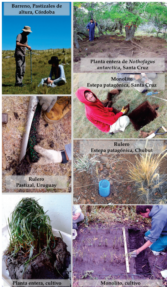
Figura 2. Métodos de muestreo empleados en distintas regiones de la Argentina y de Uruguay para obtener la fracción vegetal subterránea en sistemas naturales y en cultivos.

La elección del método de muestreo y el diseño experimental parecería estar basada en los métodos empleados previamente en el sistema de estudio de cada grupo de investigación. Es posible que esta decisión se relacione con la posibilidad de obtener resultados comparables, además de que el método esté avalado por trabajos científicos anteriores. Si bien se podría considerar que la asignación aleatoria de las parcelas de muestreo resulta más sencilla en sistemas de pastizales que en arbustales, estepas o bosques, la mayoría de las investigaciones ubican las parcelas de manera sistemática en todos los ecosistemas. La cercanía y el tamaño de los individuos parecería ser determinante tanto para muestrear cerca (e.g., bosques, arbustales, estepas) o lejos de ellos (e.g., pastizales, estepas). Por otra parte, aunque se conoce que el período del año de máxima productividad de raíces puede no coincidir con el de la productividad aérea, tal como ha sido registrado en la estepa patagónica (Soriano et al. 1987) y en pastizales (López-Mársico et al.