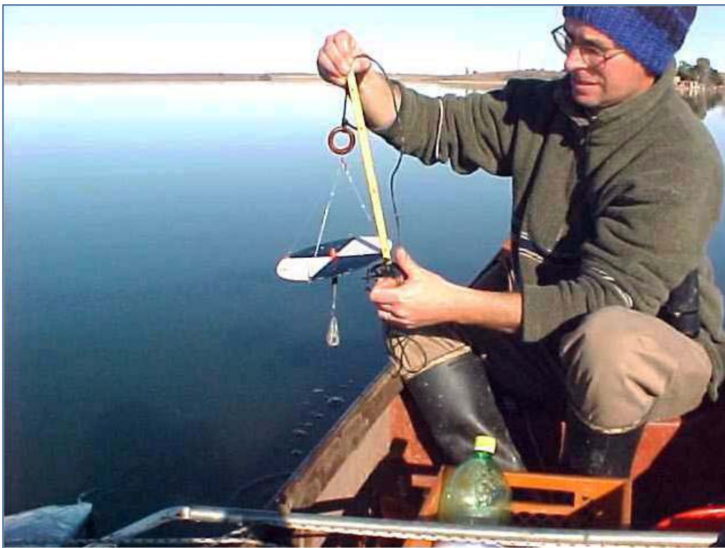
Midiendo el disco de Secchi en la laguna de Puán, muestreos en el marco de un proyecto CIC, 2005