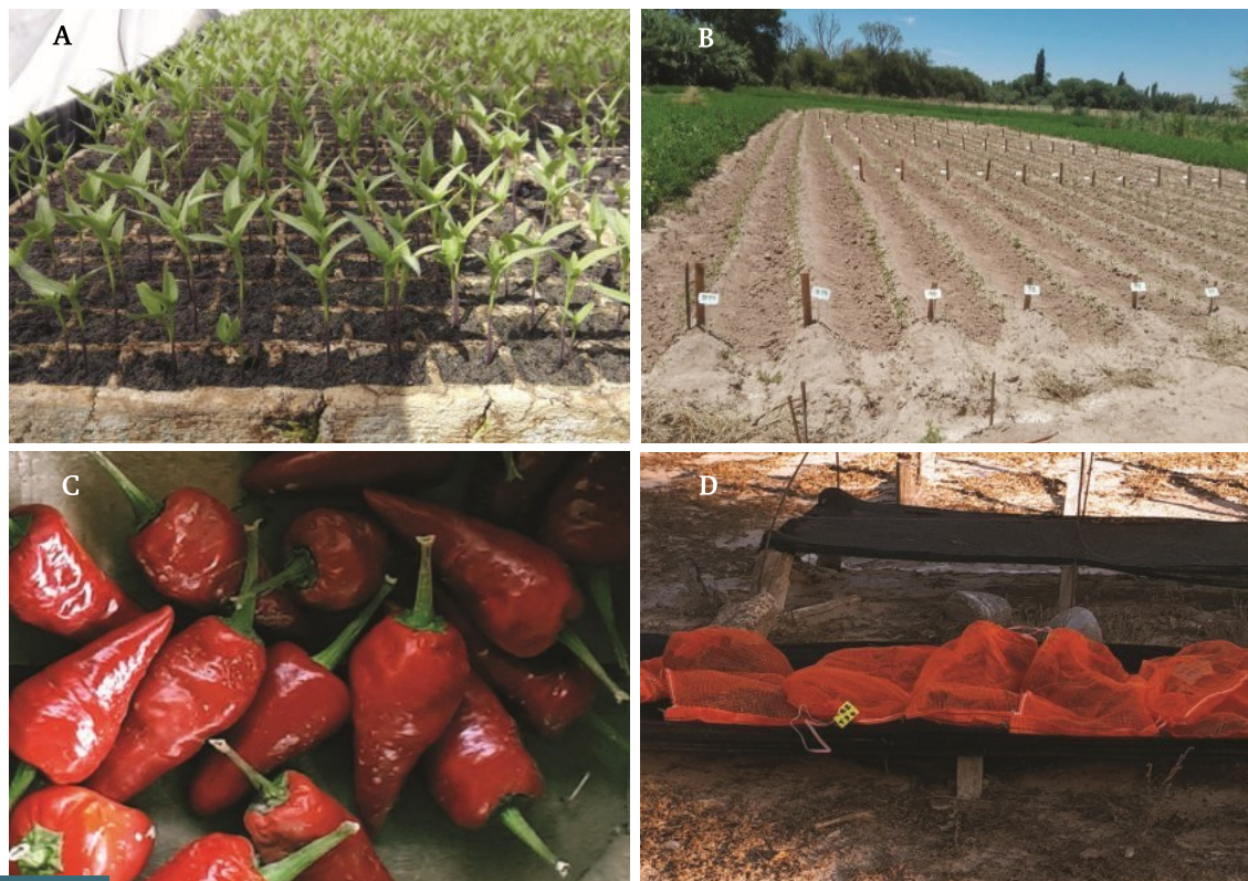
Figura 1. A. Plantines en almácigos flotantes. B. Plantación en Belén. C. Pimiento cosechado variedad “Experimental D”. D. Tendaleros con pimiento secándose.

El trasplante se realizó en líneas simples, distanciadas a 0,75-0,80 m entre sí, y 3 plantas por metro lineal, el 27/11/2018 en Belén y el 10/12/2018 en Amaicha. Los ensayos se condujeron con las mismas pautas de manejo en las dos localidades. La provisión de agua fue a través del sistema de riego por surco. Las parcelas se cosecharon desde marzo en 3 pasadas en Belén, mientras que en Amaicha hubo una sola cosecha, en abril. El secado del material se realizó sobre tendaleros en el campo experimental de INTA de Encalilla (Figura 1).