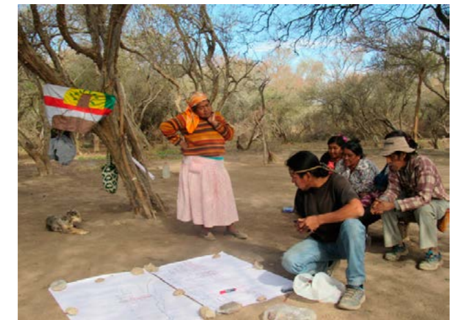
Mapeando junto al grupo de mujeres y la comisión, Misión Chaqueña, 2017

El primer momento del mapeo fue identificar aspectos naturales y culturales del territorio a partir de los relatos, historias y recuerdos de los integrantes de la comunidad. Sobre un papel en blanco se dibujó los límites de la comunidad y algunos elementos de referencia tales como caminos, rutas, ríos y otros centros poblados. En base a este mapa, elaborado por el grupo de la comisión, se fue