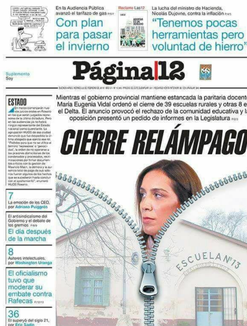
Foto 4. Tapa del periódico Página/12 en su edición del viernes 23 de febrero de 2018