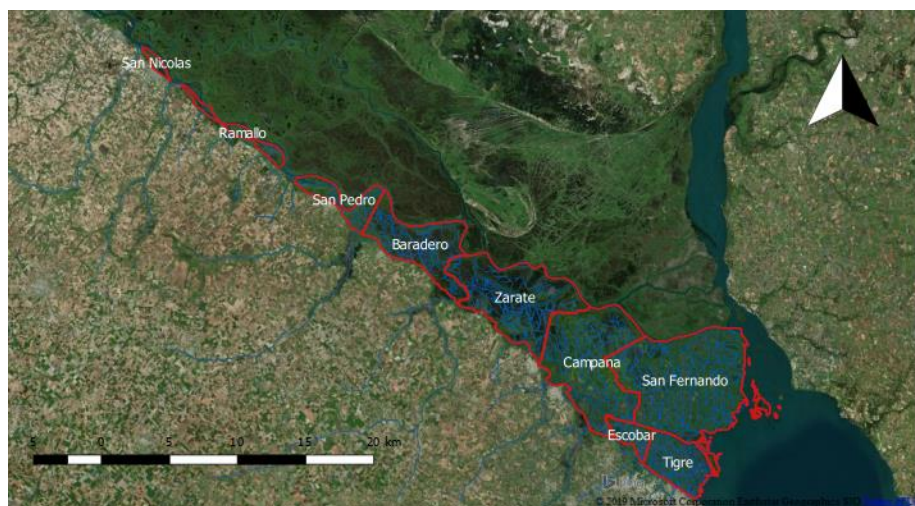
Figura 2. División político-administrativa del Delta Bonaerense del río Paraná