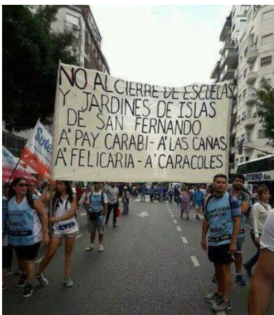
Foto 2. Movilizaciones de la comunidad educativa isleña en continente