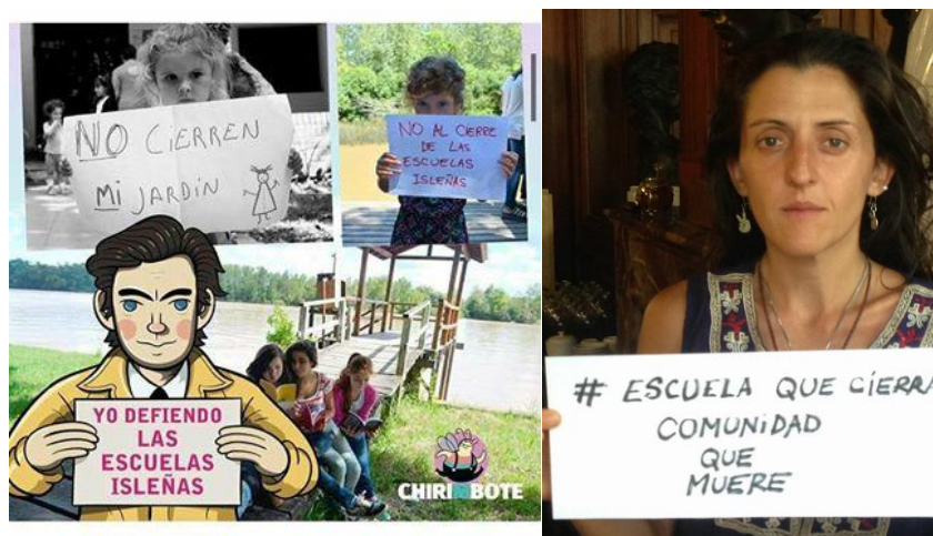
Foto 3. Formas de apoyo externas a la comunidad educativa isleña expresadas en las redes sociales