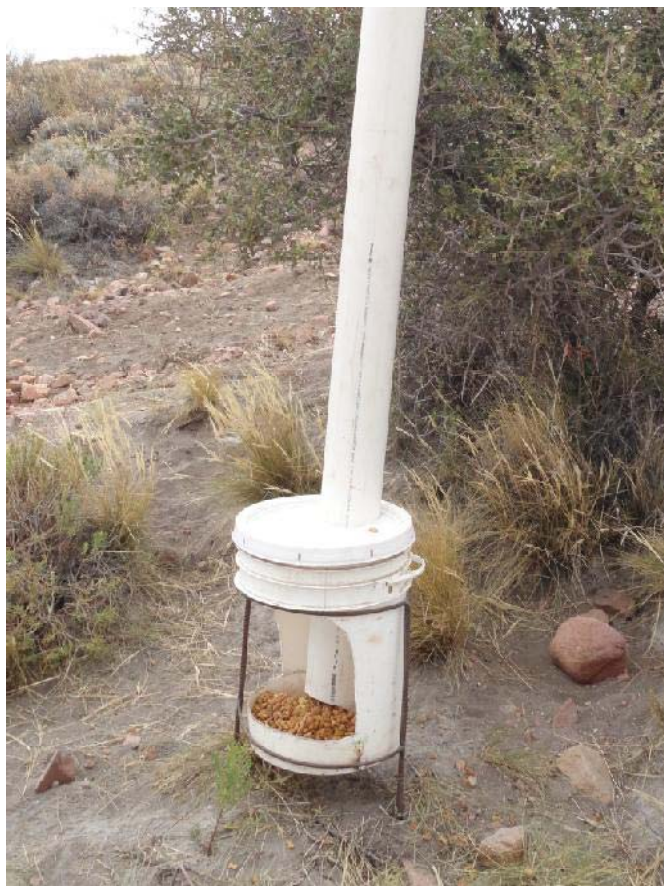
Figura 3. Comedero tipo tolva para abastecimiento semanal del perro.

jada durante el período reproductivo y las hembras atraigan perros vagabundos y jaurías durante el celo.