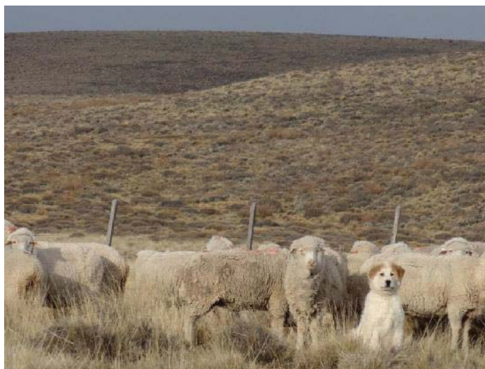
Figura 1. (a) Ovejas con cachorro de raza Montaña del Pirineo, (b) cachorro de raza Maremmano Abruzze.