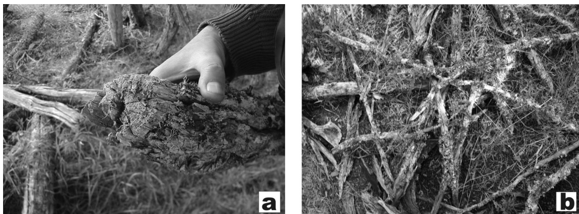
Fig. 3. Maderas en los sitios Ewan. A. Detalle de corte de troncos de Ewan I. B. Dispersión de troncos en superficie, antes de iniciar la excavación de Ewan II-estructura 1.

Además de los caracteres anatómicos se registraron una serie de aspectos que apuntan al estado y modalidad de aprovechamiento del combustible. En el caso de la madera sin carbonizar se registraron una serie de características con el objetivo de documentar tanto la modalidad de obtención como de utilización de la madera (Caruso, 2008).