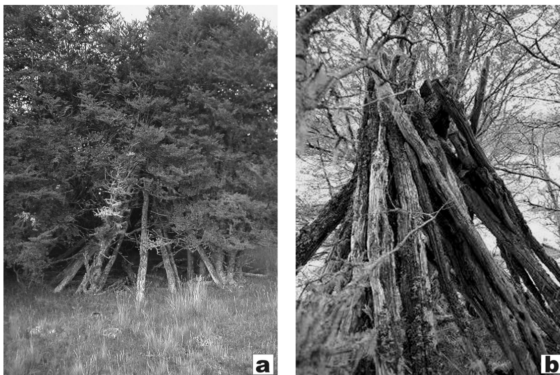
Fig. 2. La estructura de madera de Ewan I. A, vista actual de la choza. B, detalle del extremo superior.

eran susceptibles de poseer macrorrestos vegetales. En cambio los cuadros más exteriores, donde la densidad de restos arqueológicos era más baja, fueron tamizados en seco (Caruso, 2008).