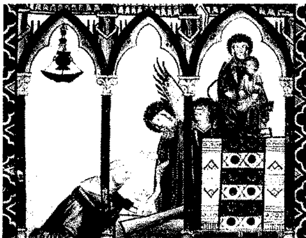
Fig. 1.— Cantiga 167. Milagro de la resurrección del hijo de una mora acontecido en el santuario de Santa María de Salas.

y al punto se derrumba la torre donde estaban ambos, sin sufrir ni ella ni el hijo herida alguna. Inmediatamente después se cuenta que ambos son bautizados. En suma, el hecho de la maternidad es lo que finalmente salva a la infiel y al niño, y veremos que esta situación será el motivo de la salvación de muchas otras figuras a lo largo de las cantigas.