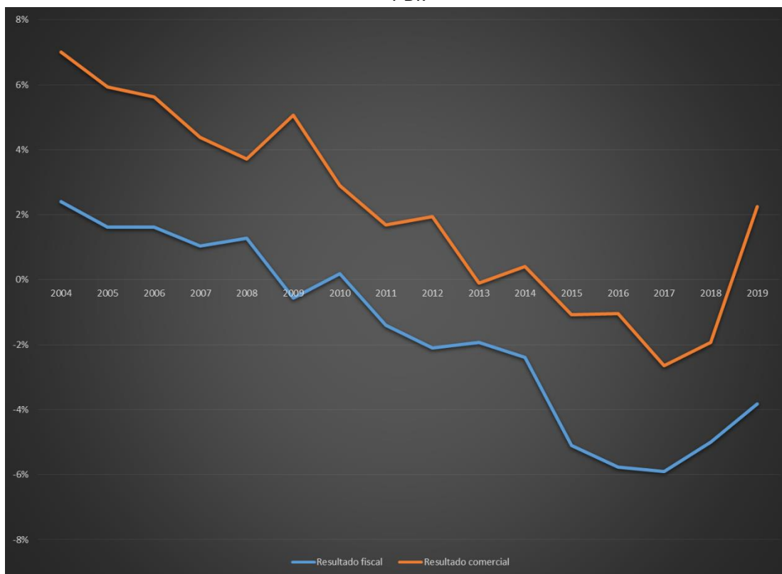
Gráfico 1. Los pilares del modelo. Resultado fiscal y Comercial, como proporción del PBI.

Nota: el cálculo del resultado fiscal sufrió revisiones metodológicas en 2007 y 2017, lo que hace que la serie no sea directamente comparable. Por lo mismo, los datos en cuestión solo deben tomarse a título de tendencia, más no es posible forzar la comparación entre períodos.