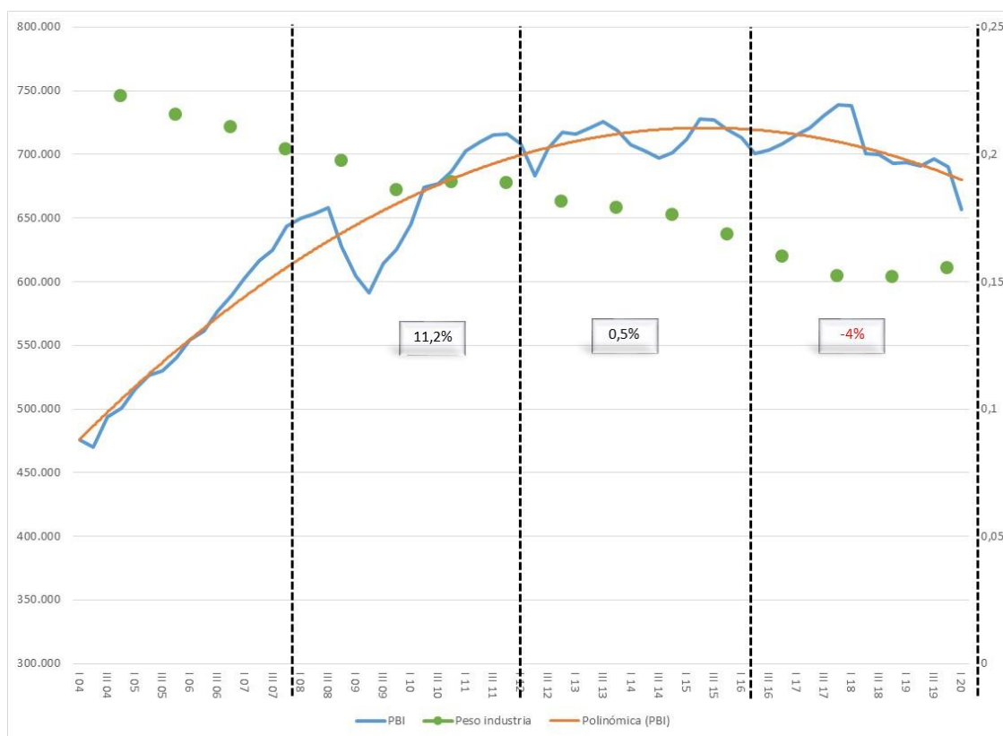
Gráfico 2. PBI desestacionalizado, millones de pesos, a precios de 2004 (eje izquierdo), y participación de la industria manufacturera en el PBI (eje derecho).