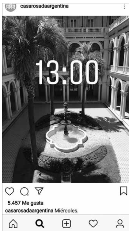
Figura 2. Miércoles. Imagen de dominio público.

cir –o imaginar– político: desde un posteo sobre el amanecer en la Casa Rosada hasta fotografías objetuales o lúdicas: una foto nadir de parte de la fachada de Casa de Gobierno o una del duende Beto, “el guardián de la huerta de la Casa Rosada” (Figura 1).