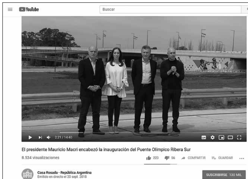
Figura 6. Inauguración del Puente Olímpico Ribera Sur. Imagen de dominio público.

ría más cercana para conversar con las autoridades de la Policía sobre todo lo que podemos hacer para cuidar el barrio”. Dentro del imaginario de Cambiemos, la mención de la gran obra pública no opera en desmedro de la pequeña obra en el barrio –como la poda o la limpieza de los sumideros– o del comedido gesto vecinal, como sacar la basura a horario. Desde una ruta nacional hasta el desagüe de tu calle, lo importante es lo concreto y lo visible de esa obra como dispositivo de contacto entre el Gobierno y el ciudadano. Es una dimensión tangible de la gestión. Sin embargo, esta veta tan palpable coexiste con una idea de eternidad o intemporalidad que la obra pública ofrecería a los ciudadanos: “Una ruta es para siempre. Un puente es para siempre. Una red de agua es para siempre. No es solo para hoy, es para siempre. Y lo que se hace para siempre es lo primero que tenemos que hacer [...] Parece mentira que estemos hablando de algo tan básico como abrir una canilla y que salga agua limpia, ¿no?”, narra uno de los spots del gobierno. El largo plazo de la obra pública –la intemporalidad del Estado– contrasta en Cambiemos, como de costumbre, con el corto plazo del populismo. Al mismo tiempo, la trascendencia de la acción pública no carece de un carácter doméstico, próximo, hogareño: la red de agua y abrir una canilla. Eficiencia, trascendencia y tangibilidad de la obra pública son elementos claves.