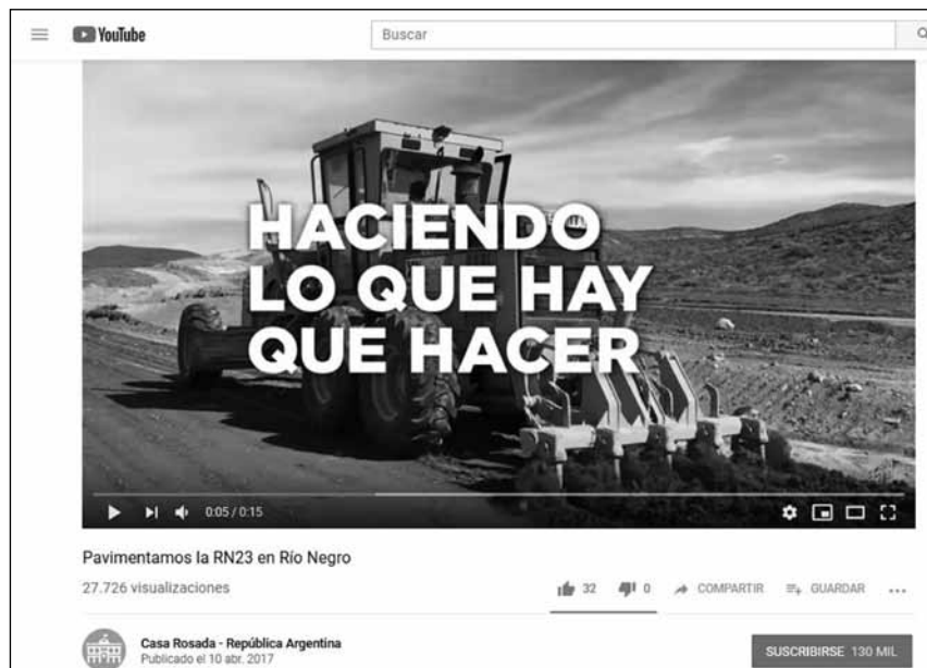
Figura 5. Haciendo lo que hay que hacer. Imagen de dominio público.

La transmisión de los actos de inauguración de obras públicas, encabezados por Macri y funcionarios de su equipo, sugiere una lógica similar. Por un lado, y en un claro gesto de oposición a los actos de los gobiernos kirchneristas, las transmisiones carecen de cualquier tipo de símbolo político-partidario y de cualquier tipo de dispositivo de asimetría: no hay banderas, no hay marchas, ni escenarios y mucho menos atriles. La austeridad de las puestas en escena nos ofrece la imagen de un gobierno sobrio, eficiente, preciso, tan lacónico cuanto espectacular (Figura 6). Por otro lado, los inserts de planos generales que muestran el proceso de la obra y el producto terminado, mientras se van sucediendo los discursos de los funcionarios, contribuyen a reforzar la idea de eficacia, “la pasión por el hacer”, sobre la cual ha insistido el presidente en repetidas oportunidades.