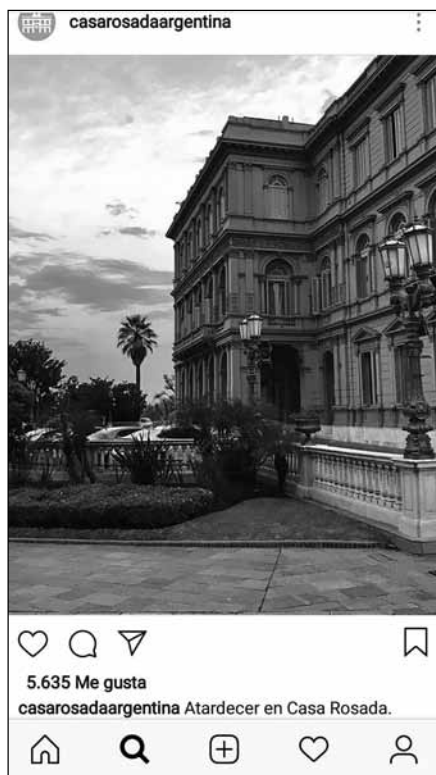
Figura 3. Atardecer en Casa Rosada. Imagen de dominio público.

Sin importar tanto qué es lo que se dice, hay toda una zona del imaginario de Cambiemos que apuesta a la política del relación asidua, frecuente, cotidiana. Estar en contacto, en diálogo, chequear la vigencia del canal: es la función fática del lenguaje, que complementa aquella otra, la expresiva, la de un emisor dispuesto a mostrarse bajo códigos estetizantes vueltos lugares comunes de la era de Internet (Prada, 2018). Más aún, hablamos de una verdadera estetización de la vida cotidiana (Lipovetsky y Serroy; 2015), que integra en ella una dimensión estético-emocional (Figura 3). Como sea, las dos funciones del lenguaje demostrarían en buena medida la adaptación del usuario “Casa Rosada” a la lógica de los medios conectivos (Van Dijck, 2016).