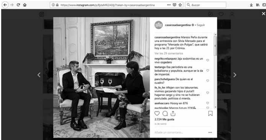
Figura 8. Entrevista con el Jefe de Gabinete, Marcos Peña. Imagen de dominio público.