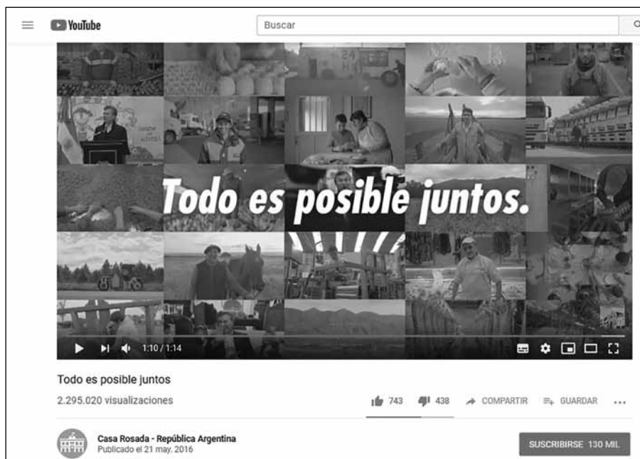
Figura 7. Todo es posible juntos. Imagen de dominio público.

ejercicio de gobierno o, en un sentido más amplio, una forma de praxis política, se revela a una mirada más atenta como una frontera conceptual de índole cultural, que distingue entre una concepción tradicional y una concepción moderna de la organización social. Es una verdadera hermenéutica histórica: a diferencia de los gastados rituales de los líderes, el trabajo en equipo se vuelve la cifra de una visión técnica y profesional del ejercicio de la política, que se pretende plenamente conforme a las características del siglo XXI