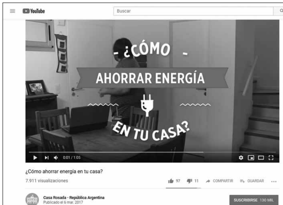
Figura 4. ¿Cómo ahorrar energía en tu casa? Imagen de dominio público.

de dos minutos los videos nos enseñan desde “cómo hacer huevos de pascua” o “cómo hacer un buen loco” hasta “cómo ahorrar energía en tu casa”. La combinación de tipografías san serif y cursivas con íconos animados sugieren frescura y proximidad.