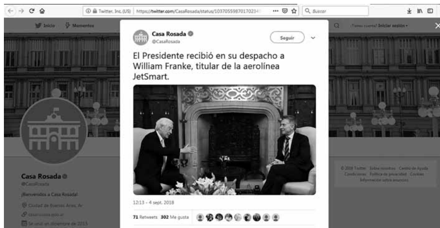
Figura 11. Recepción oficial. Imagen de dominio público.

estas noticias vuelven visible a un presidente o a un grupo de funcionarios que está lejos de los ladrillos sin revoque y de los mates con facturas que alimentan la principal línea de imaginación electoral de Cambiemos (Dagatti, 2018). Con un marcado contraste, la singularidad de su cuerpo en escena dentro de los salones de la Casa Rosada, repletos de detalles lujosos, nos recuerda la distancia que existe entre él, el Presidente, el representante máximo, y nosotros, los ciudadanos.