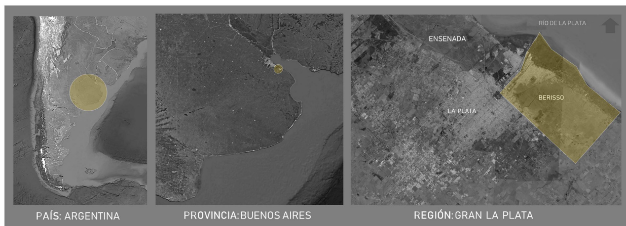
Figura 1. Provincia de Buenos Aires - Gran La Plata - Berisso.

La instalación de saladeros en el área se dio como consecuencia de una epidemia de cólera y fiebre amarilla que afectó a la capital federal en 1869 y 1870 respectivamente, promoviendo la reubicación de los saladeros radicados en la zona del Riachuelo; razones que llevaron a Juan Berisso (inmigrante genovés) a mudar su actividad desde esa zona a la Ensenada de Barragán (Aversa, 2017).