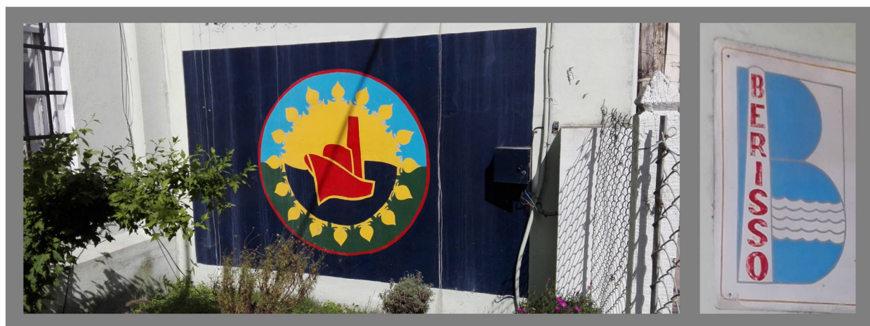
Figura 2. Bandera y escudo de Berisso.

Las principales prácticas culturales que se desarrollan actualmente en la ciudad plantean como temas centrales la inmigración (internacional e in-