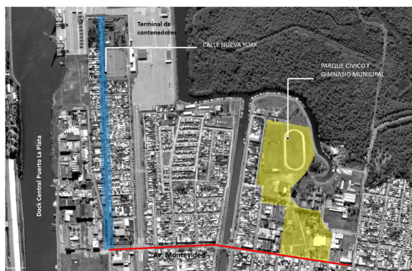
Figura 3. Localización de la Calle Nueva York y el Parque Cívico de Berisso.

Referir a las festividades populares de Berisso remite directamente a lugares específicos de la ciudad, sitios significativos acotados, que a pesar de estar unidos por la avenida Montevideo, no han logrado articularse en un circuito dedicado a la celebración de la historia y la identidad.