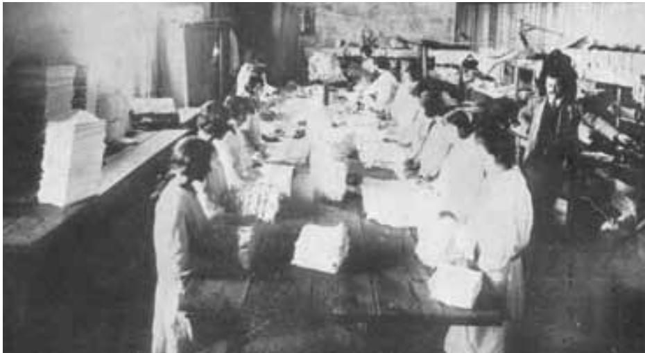
Castelar y Liniers (1920): Lavadero Gatius, Empleadas trabajando.

“Las barracas daban bastante trabajo. Después estaba el ferrocarril, mi abuelo trabajó en el ferrocarril. Tal es así... ¡mirá lo que era el ferrocarril inglés!. Que mi tía, que murió el otro día, tenía 94 años, y cobraba la pensión de mi abuelo. Porque mi