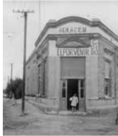
Del Valle y Castelar: Almacén El Porvenir