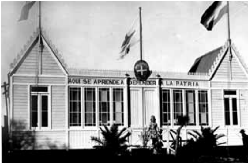
Primer local del Tiro Federal

momento, y había una tienda, un almacén, una panadería, una peluquería y la tradicional librería. Ahora todo está muy poblado y con excelentes casitas que dan su brillo al sector.”