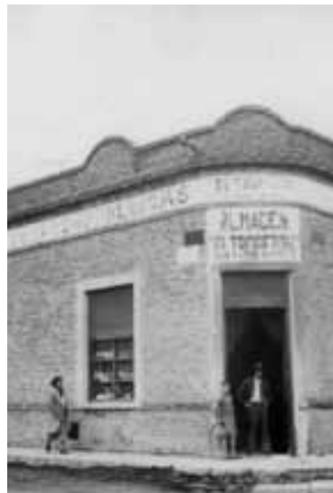
Almacén el Tropezón, Liniers y 20 de septiembre