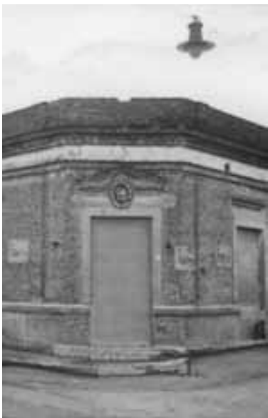
Azopardo y Castelar sede del Partido Socialista en Tiro Federal