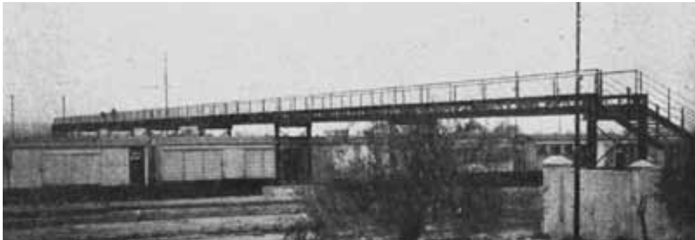
Puente negro, construido en 1918, une la calle San Martín con la avenida Parchappe.

Uno iba paseando por el centro, se sentaba pasaba las horas y después tomábamos el colectivo y volvíamos. Recuerdo que el primer colectivo que hubo en Tiro Federal, porque no había colectivos antes, cuando yo llegué. A los pocos años de estar apareció el primer colectivo se llamaba 'El Torito'. Aunque a veces uno venía caminando para no gastar los 20 centavos del pasaje."