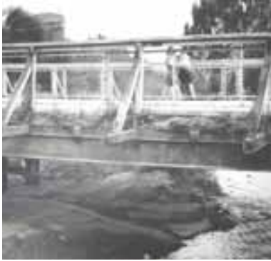
Puente calle Pellegrini