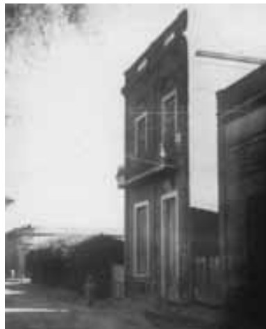
Castelar 1218, donde funcionó la Iglesia Metodista. Previamente fue sede de la Escuela 9.

El Salón de Culto estaba dónde había estado la escuela, porque la escuela se había mudado más cerca del arroyo a la calle Corrientes. Las reuniones era los domingos a las 3 de la tarde o a las 4, reunía a todos [...] Acá en Bahía Blanca había 3 iglesias católicas, estaba la Catedral, María Auxiliadora y Don Bosco y a nosotros nos quedaba muy lejos, entonces acá no había y como eran religiosas las reuniones que hacía el señor Ri-