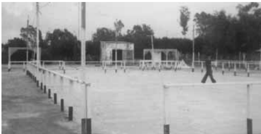
Corrientes 987, donde se realizaban los bailes y las kermeses del del Club Tiro Federal