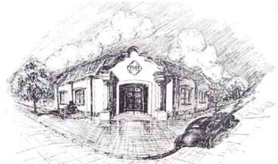
Delegación de la villas, construida en 1943, actualmente se ubica allí un jardín de infantes maternal

“Después estaban las costumbres de los vecinos, todas las tardes se iba a tomar mate a la casa de los vecinos. Un día a un lado, otro día a otro. En invierno más temprano, en verano después de la siesta. Para ‘chimentar’ un poco las cosas del barrio”