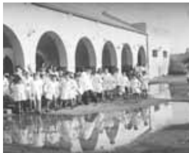
Alumnos en el patio de la Escuela 9

La escuela n° 9 empezó a funcionar a media cuadra de esta casa. En la otra cuadra [la señora Piro se refiere al edificio ubicado en Azopardo 531], porque se tardó mucho para hacerle un local propio, siempre andaba de acá para allá, porque ya no entrábamos y faltaban aulas, hasta que el gobernador Vergara donó 4 edificios, para toda la ciudad y entre ellos la escuela 9. El primer edificio, el que estaba en Azopardo tenía una piecita, la dirección y de primero de de cuarto nada más. Mi primera maestra fue la