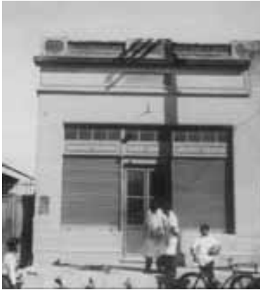
Pellegrini 628 carnicería Moreno Hermanos