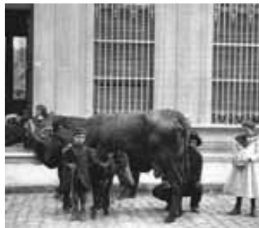
Lechero a domicilio, C.1920

FE: Iba con las vacas a domicilio, llegaba y le ordeñaba de-