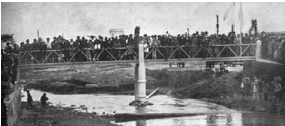
Pasarela sobre el Napostá, inaugurada el 24 de junio de 1933