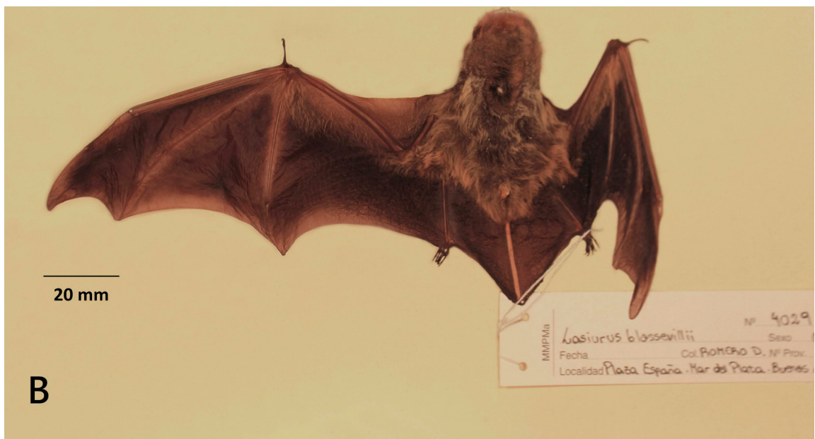
Figura 1. Piel del ejemplar de L. blossevillii depositado en la colección de mamíferos del Museo Municipal de Ciencias Naturales “Lorenzo Scaglia”, Mar del Plata (MMP-Ma 4029). A) Vista dorsal; B) Vista ventral.