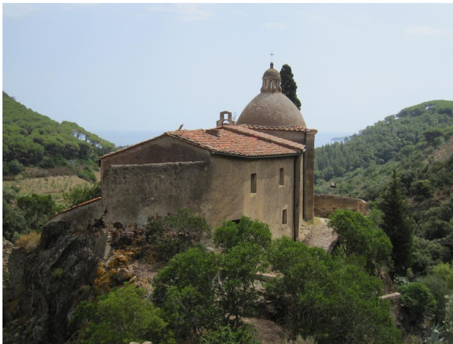
Figura 4 Santuario de Monserrato en la Isla de Elba

El santuario ha sido reabierto para funciones religiosas tras haber sido restaurado (Figura 4).