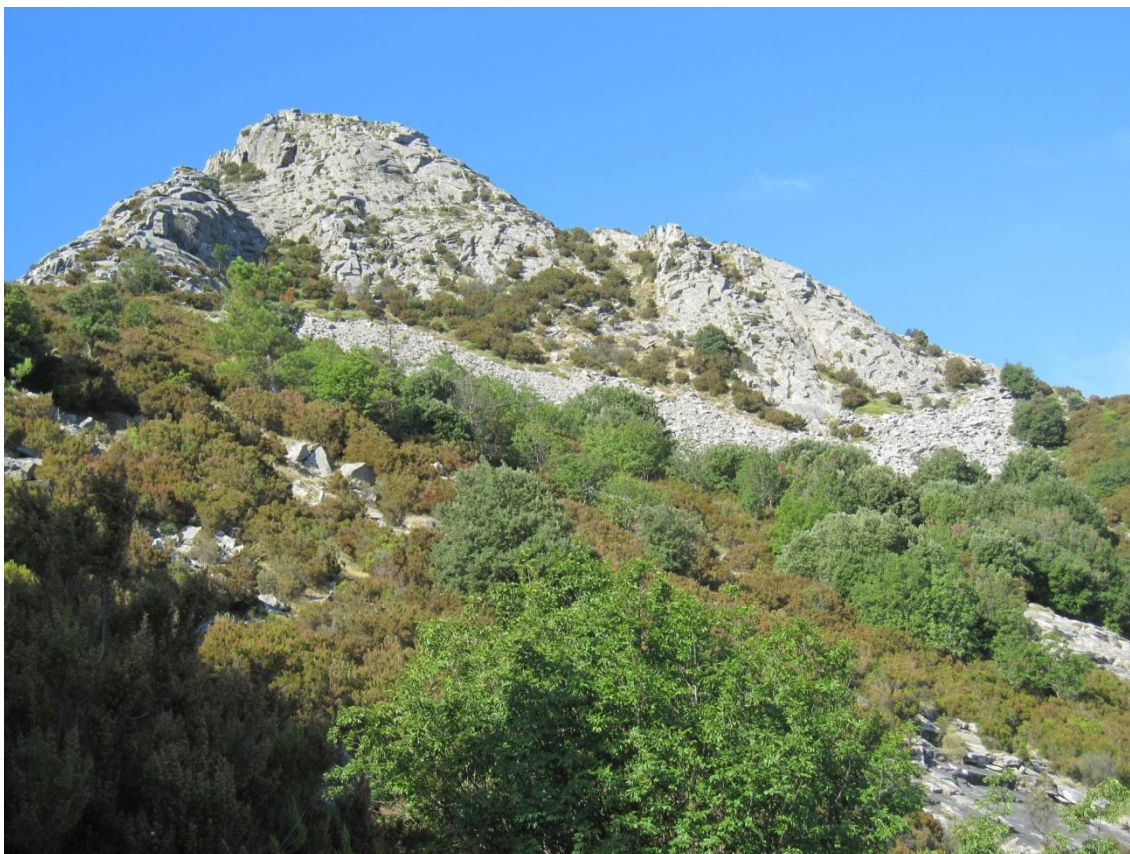
Figura 5 Monte Capanne

El monte Capanne es un macizo granítico que alcanza 1019 metros sobre el nivel del mar y constituye la máxima altura de la isla de Elba -y de todo el archipiélago toscano- (Figura 5).