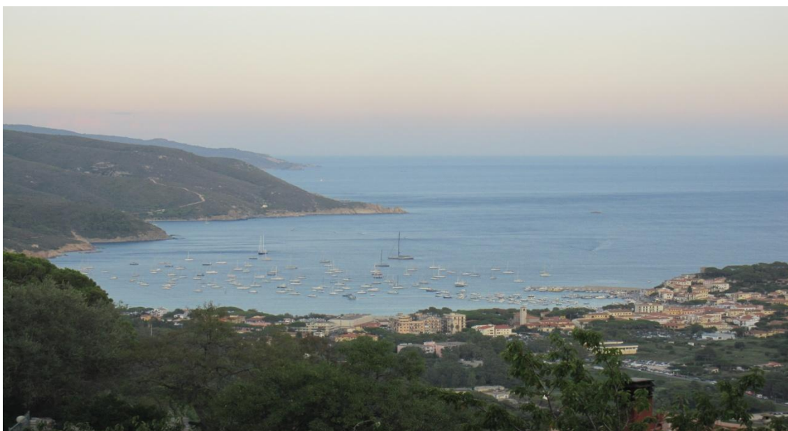
Figura 1 - Paisaje costero en la isla de Elba

El territorio elbano se halla organizado políticamente en siete comunidades, que reconocen respectivamente como cabeceras a los poblados de Campo Nell' Elba, Capoliveri, Marciana, Marciana Marina, Porto Azzurro, Porto Ferraio y Río Nell' Elba. Es frecuente la articulación de dos comunidades cercanas a modo de binomio, en el que el asentamiento costero cumple funciones de puerto y el poblado al interno se convierte en el núcleo principal. Tal es el caso del poblado de Marciana, distante seis kilómetros del puerto de Marciana Marina, a los pies del monte Capanne. La tradición de establecer asentamientos cierta distancia de la costa se fundamentaba antiguamente en la necesidad de procurar protección frente a los ataques de flotas piratas (Figura 1).