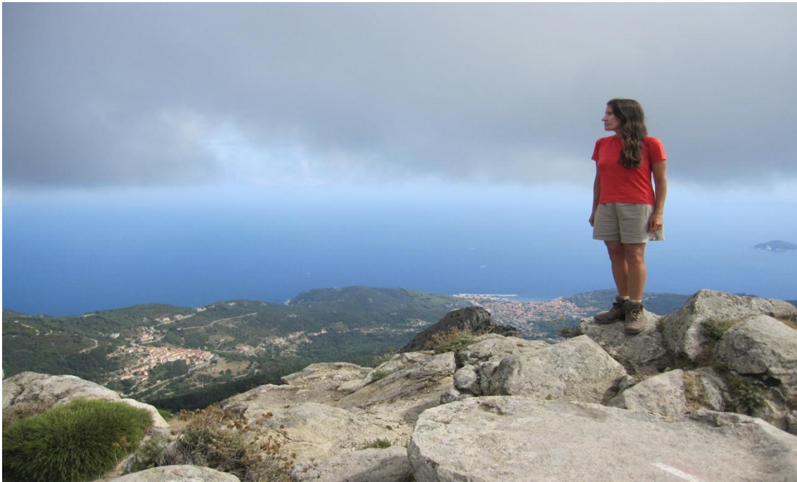
Figura 6- La autora en la cima del Monte Capanne

alfabeto grabadas en la roca, probables iniciales de nombres que testimonian ascensiones realizadas décadas atrás, cuando los grafitis incisos no eran considerados una práctica condenable.