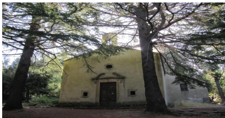
Figura 7- Cenobio de San Cerbone en Elba

El sendero que une la cima del monte Capanne con la aldea de Marciana atraviesa espacios sacralizados por su vinculación con la figura de San Cerbone, un monje ermitaño a quien se atribuye la construcción de una ermita o “romitorio”. El romitorio de San Cerbone data del siglo XV y ha sido restaurado en años recientes (Figura 7).