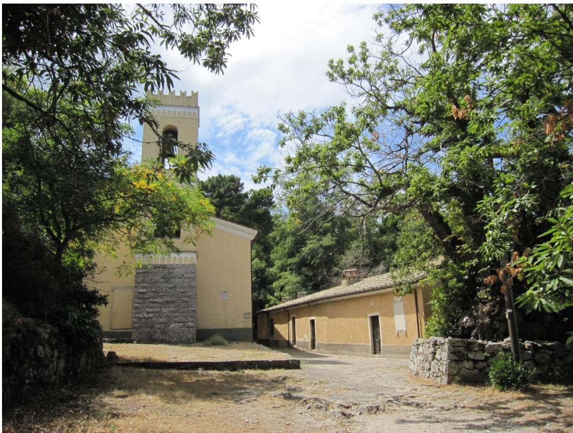
Figura 8 - Santuario de Madonna del Monte

A comienzos del siglo XIX, durante diez días de verano, se hospedó allí Napoleón Bonaparte, para mantener un discreto encuentro romántico con su amante polaca, María Walewska.