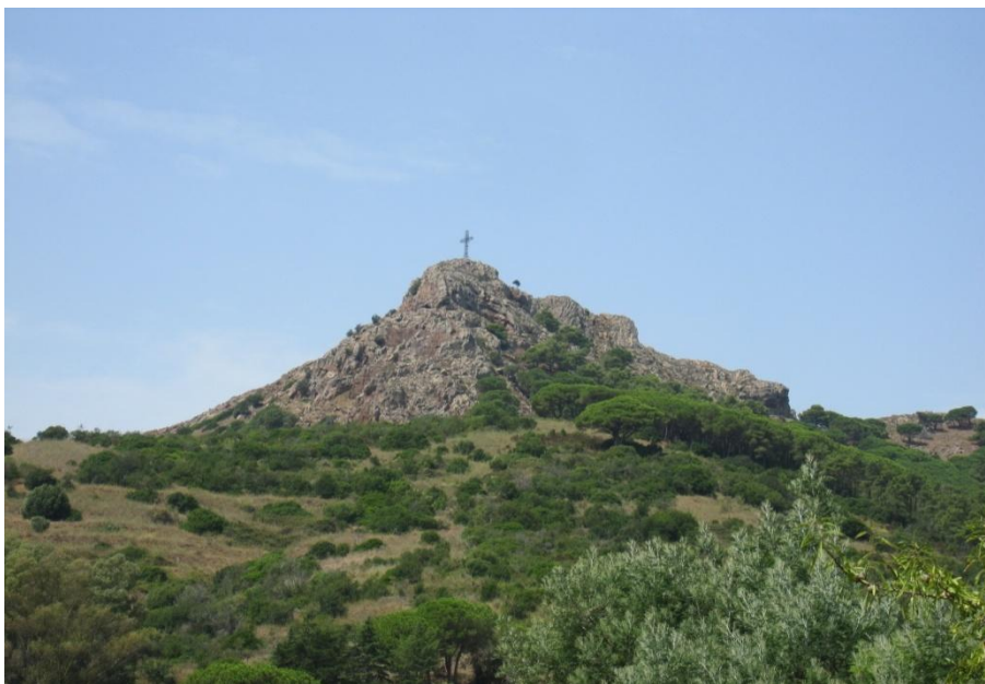
Figura3- Monte de la Cruz en la Isla de Elba

La localidad costera de Porto Azzurro se extiende a los pies de un distintivo monte, coronado con una vistosa cruz (Figura 3).