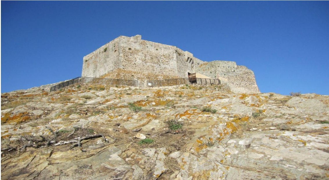
Figura 2- Fortaleza de Volterraio en la Isla de Elba

En cuanto al origen del nombre, se han formulado diversas hipótesis. En principio, podría tratarse de una derivación del vocablo compuesto etrusco “ ful-tur ”, traducible como “castillo en lo alto” o “fortaleza elevada”. Se reconoce asimismo que el nombre Volterraio remite al topónimo del poblado etrusco de Volterra, en las inmediaciones de la ciudad de Pisa. Justamente, durante la dominación de la isla de Elba por parte de la República de Pisa (entre los siglos X y XI AD) se construyó la fortaleza medieval que corona la cima del vistoso promontorio (Figura 2).