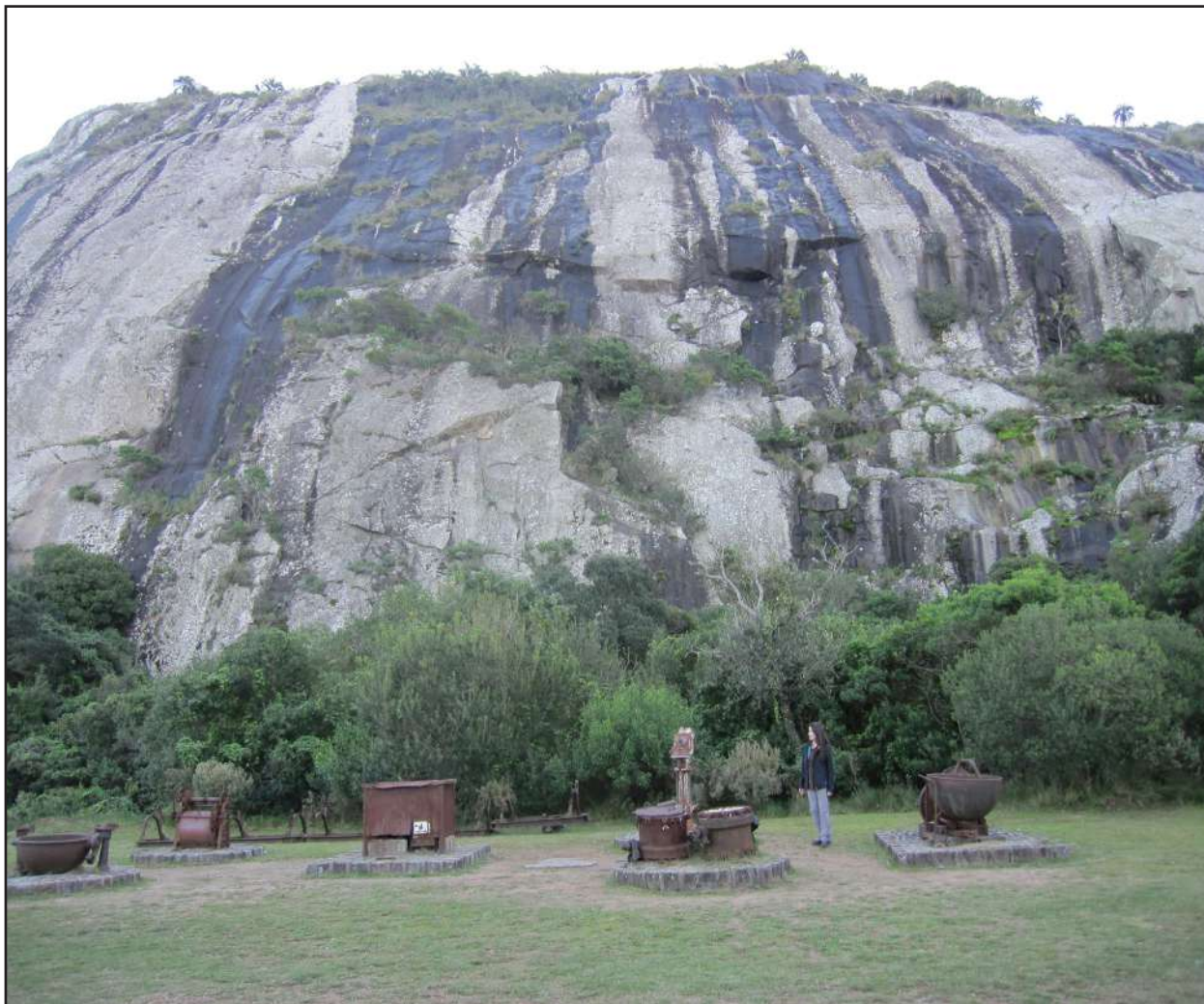
Rocosos contrafuertes del monte Pan de Azucar

de la actividad minera. Adyacente a la base del cerro, en unos distintivos afloramientos rocosos de acceso restringido, se encuentran algunas de las manifestaciones de arte rupestre más significativas de esta región de Uruguay, que han sido declaradas Monumento Histórico Nacional. El emplazamiento de estas pictografías sugiere la importancia simbólico-religiosa que dicha montaña debió haber revestido para los habitantes originarios.