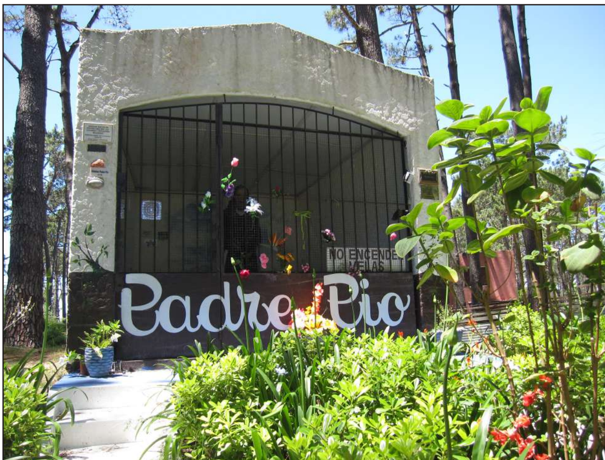
Ermita del Padre Pio en La Barra

El interior de la península concentra residencias veraniegas del siglo XIX, una estación meteorológica, un imponente faro marítimo erigido en 1860 y la parroquia de Nuestra Señora de la Candelaria, construida en estilo neo-románico. Sin embargo, el punto culminante de la geografía sacralizada de Punta del Este se encuentra situado entre afloramientos rocosos y olas rompiendo. Se trata de una pequeña ermita dedicada a la Virgen de la Candelaria, que congrega a numerosos fieles y devotos durante todo el año y ha quedado íntegramente cubierta con placas de agradecimiento y exvotos. La ermita fue inaugurada el 2 de Febrero de 1982 y es obra del escultor Mario Lazo. Su emplazamiento y la fecha de su inauguración promueven el sin-