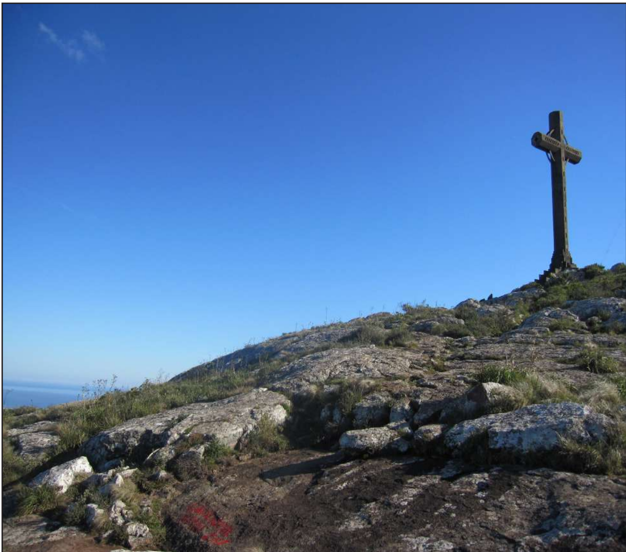
Cruz en la cima del Pan de Azucar

masivamente como meca de peregrinaje devocional. La autora ascendió en una soleada tarde con temperaturas otoñales agradables, esperando encontrar una significativa cantidad de devotos caminantes, por tratarse de un día Domingo. Sin embargo tan solo cruzó a dos turistas argentinos y a un puñado de jóvenes senderistas uruguayos. Quizás las dificultades del terreno amedrentan a potenciales devotos con menores habilidades para el excursionismo. Aparentemente en las alturas de este monte hay presencia de parapetos y otras estructuras de piedra de antigüedad arqueológica (véase