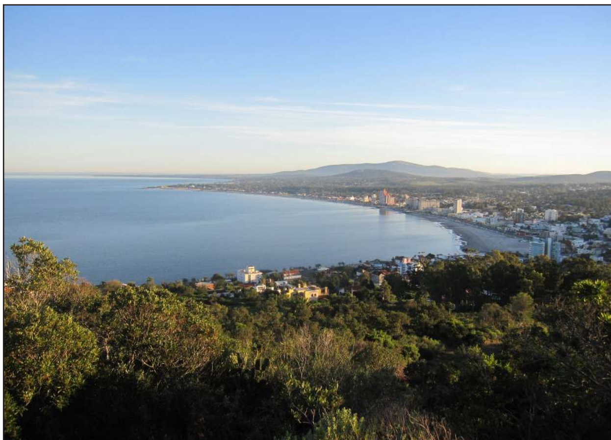
Vista de Piriápolis desde la cima del cerro San Antonio