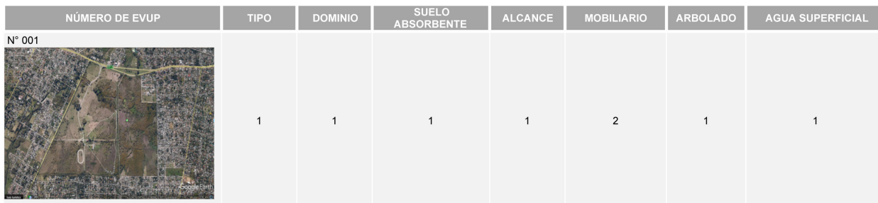
Tabla 3: Ejemplo matriz de datos con un EVUP.