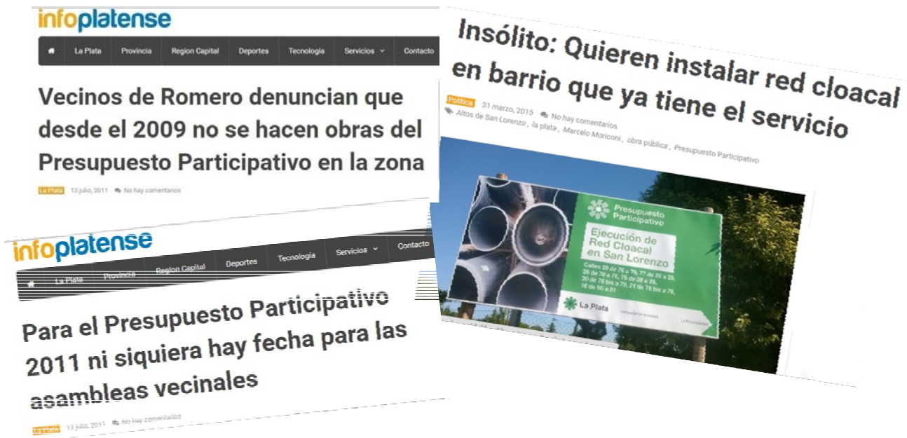
Fig. 1: Información periodística. Fuente: Internet http://infolatense.com.ar/ .

presupuesto participativo pudo generar conflictos en relación al modo en que la intersectorialidad es incorporada en la ejecución del instrumento, ya que generar una nueva dependencia puede favorecer la desarticulación y perder la integralidad de los problemas, además de incorporar nuevos actores e instituciones quizás innecesarias. Repetto (2008) menciona que el exceso de subdividir organismos en diferentes áreas puede conllevar a generar tensiones en las relaciones de poder de quienes están a cargo, provocando la ineficacia e ineficiencia del sistema. Estas cuestiones pueden reflejarse en la opinión de algunos vecinos en relación a lo producido con los recursos de esta herramienta.