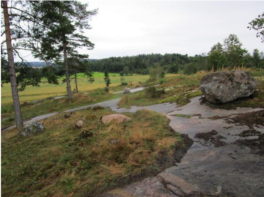
Fig. 1 Colina sagrada de Aspeberget en Tanum, Suecia

Litslebyle, la colina sagrada de Aspeberget (Figura 1) y el centro de visitantes de Tanum.