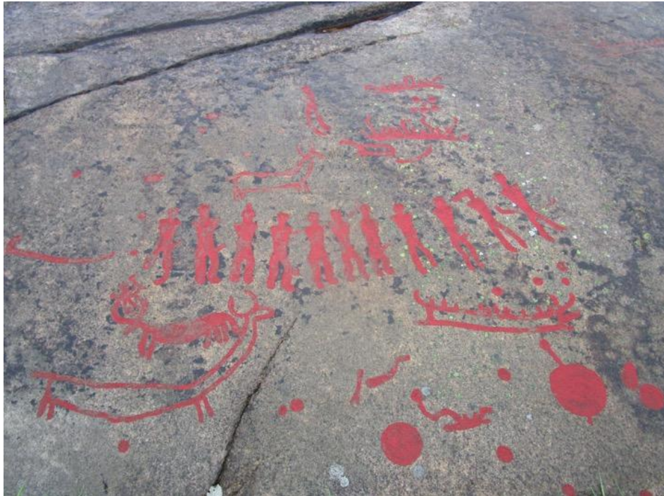
Fig. 6 Panel que representa procesión religiosa en la antigüedad escandinava.

testimonios de la presencia de la divinidad durante el ritual 46 . Los motivos con forma de “Y” pueden ser “adoradores” o figuras humanas rezando con los brazos elevados al cielo. Dichas imágenes se complementan simbólicamente con los motivos procesionales de antropomorfos en fila, presentes en la colina de Aspeberget (Figura 6).