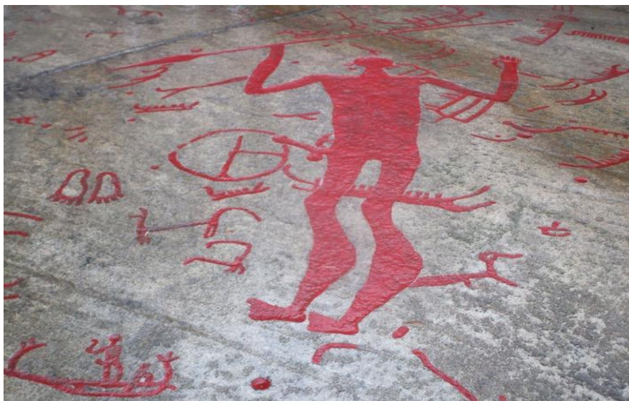
Fig. 4 Deidad de la Lanza. (© María Constanza Ceruti)

La colina de Aspeberget ofrece una amplia vista panorámica del paisaje circundante y ha merecido el calificativo de “montaña sagrada”, según la folletería elaborada en el museo de Tanum. Se encuentra cubierta con motivos incisos que representan barcas y discos solares, escenas de caza y figuras de acróbatas a bordo de barcos, entre otros. Sobresale en uno de los paneles principales un motivo grupal: una fila de antropomorfos que ha sido interpretada como la representación de una procesión religiosa.