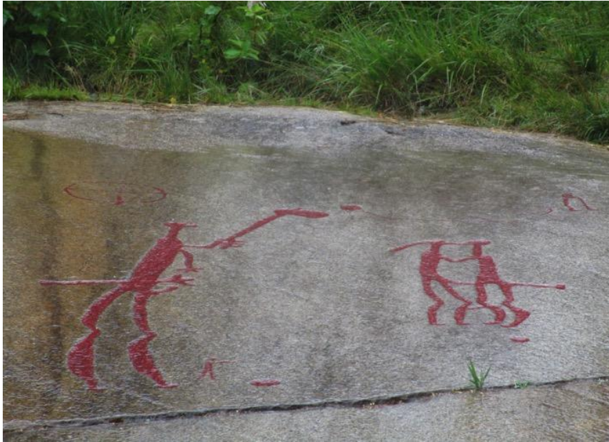
Fig. 2 Antropomorfo con estandarte y motivo de los amantes.

Este mote de “majestáticos” se aplica a dichos montículos fúnebres por su articulación con la creciente estratificación social durante la Edad de los Metales. En razón de las influencias mediterráneas que llegaban al norte de Europa, se conoce a dichos túmulos como “las pirámides escandinavas”.