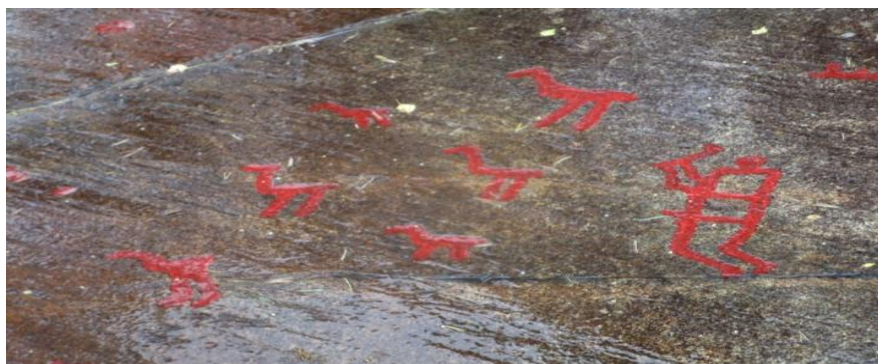
Fig. 5 Motivos zoomorfos representando cigüeñas.