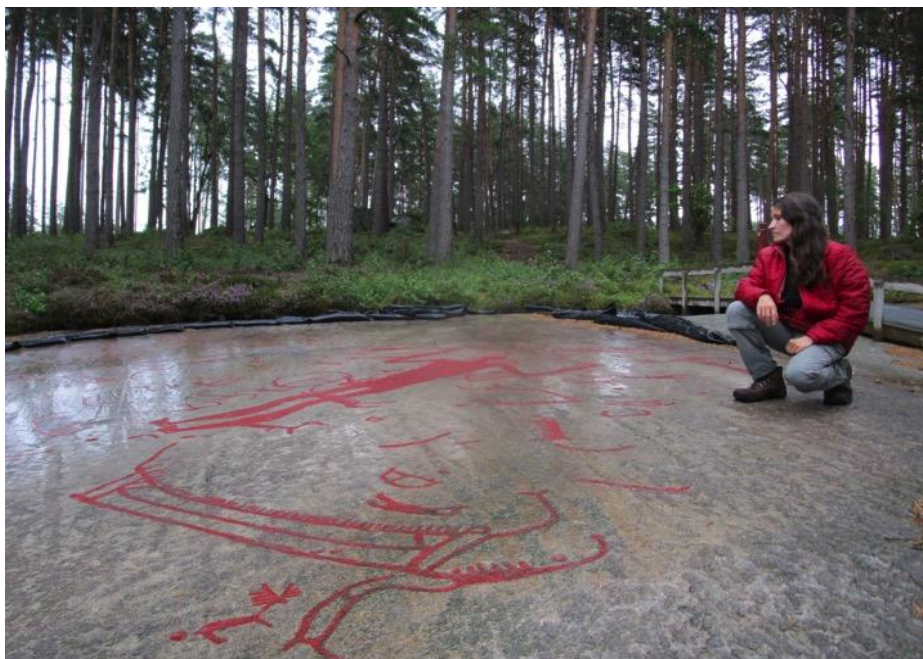
Fig. 3 Petroglifos de barcos típicos del arte rupestre del sur escandinavo.

Por su parte, el panel de Litsleby se destaca por el gran tamaño de una representación masculina, de aproximadamente 2,3 metros de alto, que constituye el petroglifo antropomorfo más grande de Escandinavia (Figura 3). Denominada coloquialmente como “la deidad de la lanza”, ha sido interpretada como una entidad atmosférica, precursora de la figura del dios nórdico Odín.