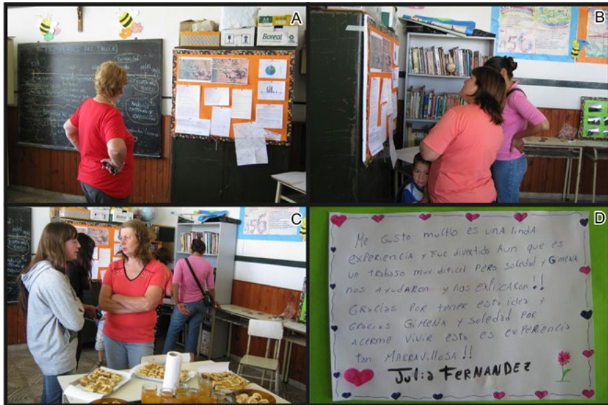
Figura 3. Muestra de las actividades realizadas; a, b y c: comunidad participando de la muestra; d: devolución de una estudiante.

Por último, se acordó realizar una charla con personas de la Asociación Amigos del Tren de Bartolomé Bavió, quienes han realizado muchas investigaciones acerca del paso del tren en las localidades del partido. Los estudiantes escucharon atentamente, realizaron preguntas y manifestaron sus inquietudes.