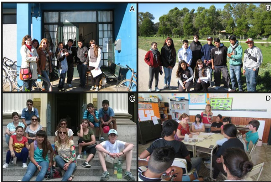
Figura 2. a: Fachada de la escuela con docente, preceptora y alumnos; b: alumnos durante la salida de prospección; c: visita al Museo de Ciencias Naturales, La Plata; d: análisis del material arqueológico recuperado en la excavación.

En el siguiente encuentro, se expusieron los materiales y la información hallada en todo el proceso de investigación en una muestra abierta a la comunidad para dar a conocer todas las tareas realizadas y resultados obtenidos. Se acercaron las familias, directivos de la escuela, personas entrevistadas y la comunidad en general. Todos los participantes demostraron su alegría y agradecimiento a las coordinadoras del trabajo y a los estudiantes por el compromiso y labor realizada para el pueblo. Los estudiantes realizaron una cartelera con su devolución de las actividades realizadas, las auxiliares docentes realizaron pasta frola, la cual se compartió entre anécdotas e historias (Figura 3).