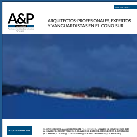
Imagen de tapa :

Federica Visconti (Universidad de Estudios de Nápoles "Federico II". Nápoles, Italia)