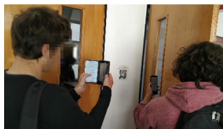
Figura 3. Participantes de la V Expo Ciencia usando el juego co-diseñado.

El juego móvil creado fue brindado a los participantes de la V Expo Ciencia de la Facultad de Informática (UNLP, Argentina), quienes lo instalaban y comenzaban a jugar. En la Figura 3 se puede apreciar dos participantes leyendo un código QR del juego. Una vez que respondían todas las preguntas debían regresar al stand para completar el código de finalización del juego. Los resultados fueron almacenados en un servidor para poder saber en tiempo real quien había respondido correctamente todas las preguntas en el mejor tiempo. Si bien pasaron por el stand a instalarse el juego unos veinticinco participantes, solo dieciséis volvieron al stand a buscar el código de finalización. Los participantes que finalizaron el juego manifestaron que la experiencia fue interesante y novedosa al tenerse que mover por el edificio para ir encontrando las preguntas.