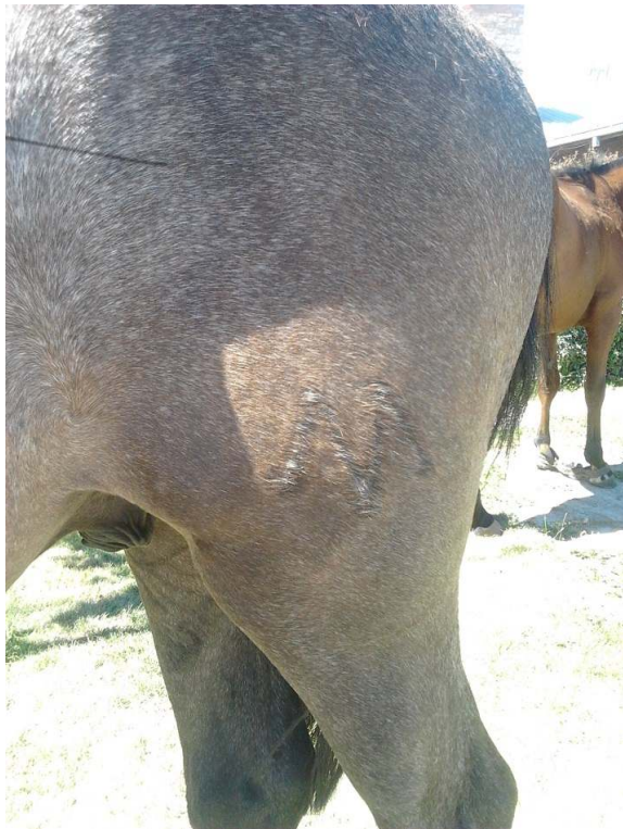
Imagen 1: Ejemplo de una marca a fuego en el anca de un equino.

debe dar lugar a una intervención policial que indique a qué establecimiento pertenecen los animales, en qué departamento y ubicación catastral se encuentran, qué tipo de animales están viajando y con qué finalidad.