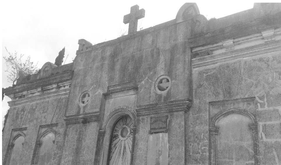
Cementerio Municipal de Pergamino.

En el mismo cementerio hay panteones de la sociedad francesa, española, dos italianos y varias tumbas irlandesas, evidenciando la importancia que tuvo esta ciudad para la migración y el modelo agroexportador, pero con antecedentes en haber sido una de las postas hacia el Alto Perú.