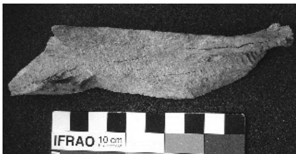
Figura 2. Desecho de fractura helicoidal.

Como se mencionó anteriormente, uno de los aspectos más destacados de este sitio lo constituye la presencia de una gran cantidad de restos de peces. El