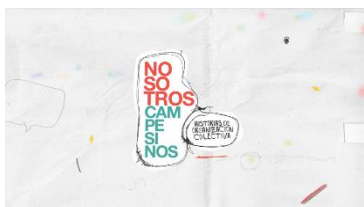
Ilustración 1 Placa Inicio

En un segundo momento explicitaremos nuestros puntos de encuentro y reflexión acerca de las subjetividades y las producciones de imágenes desde el punto de vista de la Teoría social y los Estudios Visuales. La noción de producciones de subjetividad (Bonvillani, 2009; Rancière, 2000, Guattari, 1996), dispositivo (Deleuze, 1990) y reparto de lo sensible (Rancière, 2009) se vuelven fundamentales en la construcción de la caja de herramientas teóricas (Bonvillani, 2012). Esto nos permitirá hacer dialogar tanto la trayectoria teórica asumida por la autora de estas reflexiones desde su trabajo de tesis doctoral, y la línea propuesta por la doctora Bonvillani. Adelantando la lectura, aclaramos que, al no ser posiciones antagónicas ni desencontradas, hemos podido establecer lecturas hermanadas que han ayudado a seguir construyendo/deconstruyendo el problema de tesis que nos convoca. En este sentido la subjetivación y la noción de dispositivos han sido herramientas fundamentales para re-mover las preguntas iniciales de la tesis de posgrado.