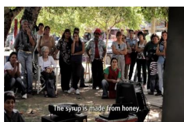
Ilustración 5 Proyección del Video Campesino