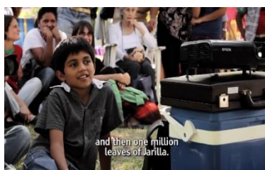
Ilustración 41 Proyección del Video Campesino