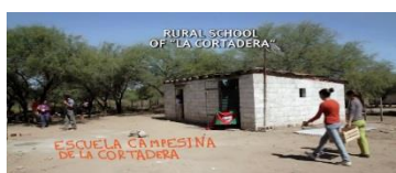
Ilustración 11 Educación