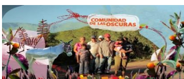
Ilustración 10 Comunidad

El nosotros compone una postura social y existencial, que se expresa y materializa en las imágenes. La propuesta de realización de un video por parte de los protagonistas de los documentales -esta doble imagen de los presentados y expresados- viene a recomponer este doble vínculo histórico que les fue negados: invisibilizados y no reconocidos. En este sentido como práctica política, en el sentido que lo piensa Rancière (2000) hacen intervenir otra distribución de las maneras de ser, de decir y hacer formas de su visibilidad (Rancière, 2009). En sus prácticas artísticas hacen intervenir el común, el nosotros en formas de posiciones, de palabras, de enunciados.