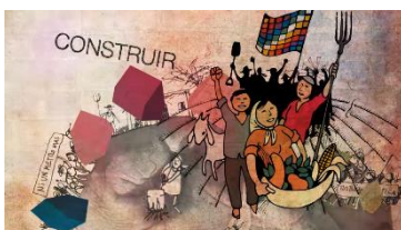
Ilustración 2 Collage de presentación