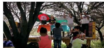
Ilustración 18 Filmación Hierbas medicinales

El ethos de la libertad también implica el cuidado de los otros. Tanto para Foucault (1994) como para Rancière (2000), la libertad implica necesariamente una relación con el otro, una subjetivación de la alteridad. Conlleva una identificación imposible, Nosotros, campesinos , deviene lógica del otro, en forma de determinaciones de alteridad , en el sentido de Rancière (2007). La polémica que implica que el principio de la igualdad sea, es el de la diferencia. En el reparto desigual del sistema neoliberal del cual nos advierten en la introducción de cada capítulo del documental, entra incluso el reparto de la representación del sí mismo como sujeto representable en la visibilidad en los medios. La relación con el otro no procede por identificación de ícono preexistente, inherente a cada individuo. Dentro de las configuraciones subjetivas (Bonvillani, 2017) experiencias dinámicas, y los modos de subjetivación como prácticas de saber/poder, transformar, siempre con la lógica del otro. “La imagen es portada por un devenir otro, ramificado en devenir animal, devenir planta, devenir máquina y llegado el caso, devenir humano” (Guattari, 1996, p.117).