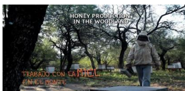
Ilustración 13 Trabajo en el monte

Estos dispositivos de visualidad de los campesinos, basados en el producir como reparto de las ocupaciones, manifiesta su principio: “la transformación de la materia sensible en la presentación de la comunidad a sí misma” (Ranciere, 2009, p.57).