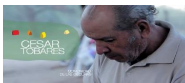
Ilustración 8 Campesino