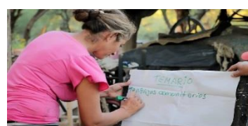
Ilustración 15 Organización

Las prácticas para replicar y repartir el conocimiento nativo, funciona como un acontecimiento portador de intervenciones pragmáticas orientadas a la construcción de subjetividad colectiva e individual. Al decir de Deleuze (1990), en este dispositivo se dan procesos de enunciación de un yo comunitario a la vez de visibilización de saberes nativos,