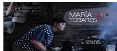
Ilustración 9 Campesina

Sostenemos que las series federales, dentro de las cuales encontramos a Nosotros, campesinos , como un horizonte comprensivo que nos anticipa ya de sentido, visibilizan procesos de subjetivaciones; en términos de Rancière (2000; 2009), son políticas ya que ponen de manifiesto ciertas relaciones de igualdad/alteridad, mostrando líneas de fuga, como ciertos agenciamientos desde la subjetividad.