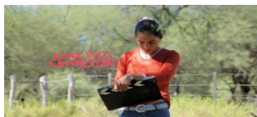
Ilustración 17 Video Campesino