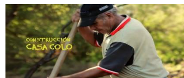
Ilustración 12 Construcción