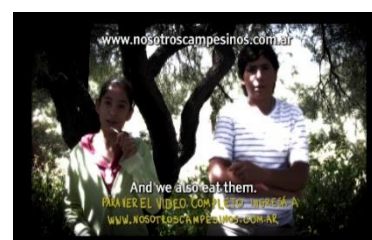
Ilustración 6 proyección del Video Campesino

Los partícipes del documental, las Comunidades, son las que realizan las propias entrevistas y registros, los que vemos que sostienen la cámara, diseñan el documental y realizan los guiones. Cuando el documental nos muestra imágenes tomadas por ellos las vemos resaltadas en un marco que nos recuerda que estamos viendo con sus propios ojos lo real, sus mediaciones. Se propone como un intercambio de miradas, una visibilización de sus posturas, re-subjetivaciones constituyentes del nosotros.