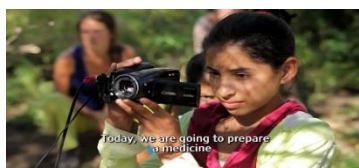
Ilustración 16 Camara

estas líneas que se enmadejan dejan fisuras y fugas que al choque con otros dispositivos generan nuevas formas de re-subjetivaciones.