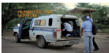
Ilustración 14 Movimiento