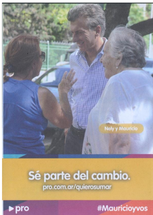
Figura 2: Folleto, 2015b, Prensa Pro.