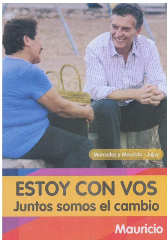
Figura 1: Folleto , 2015a, Prensa Pro.

Mariano Cicowiez. Opacidad de un signo electoral: Estudio de las imágenes técnicas de la campaña de Cambiemos 2015