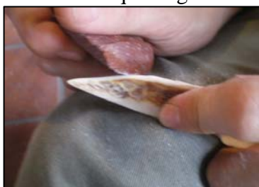
Figura 1. Raspado de hueso durante la formatización de un punzón

1. Seleccionamos un sílex marrón rojizo oscuro, materia prima proveniente de la localidad arqueológica de La María, ubicada en nuestra área de estudio. Este tipo de sílex es preponderante en sitios arqueológicos de la región, y con él se han realizado otras experimentaciones (Cueto y Frank 2004, Frank et. al. 2008). Generamos una colección experimental de referencia de veintitrés lascas. (Ver Tabla 1 al final del documento).