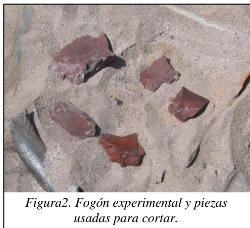
Figura2. Fogón experimental y piezas usadas para cortar.

3. Tratamos térmicamente diecisiete lascas, incluidas las cuatro ya trabajadas. La experimentación se realizó en dos fogones, buscando reproducir las características y dimensiones de los fogones de sitios del área de estudio (Paunero 2001, Paunero et al. 2007). Las piezas fueron cubiertas previamente con arena, lo que posibilita que el calor se disperse homogéneamente y evita el contacto directo de las piezas con el fuego. La duración de los fogones fue de aproximadamente 24 horas. En el primer fogón se ubicaron las piezas relacionadas con el raspado de hueso y la temperatura máxima alcanzada fue de 340° C. En el segundo fogón se ubicaron las piezas relacionadas con el corte de hueso y la temperatura máxima alcanzada fue de 312° C. (Figura 2).