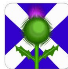
Figura 3. Extracto de la actividad de introducción de Gwen

La proporción de escoceses portadores de un gen que origina el rojizo es aproximadamente p=0,4 . De una muestra de 50 escoceses, todos seleccionados de una misma población, 17 son portadores de este gen. ¿Podemos considerar, con una tolerancia del 95%, que la población de portadores del gen es la misma en esta muestra de la población que entre el conjunto de escoceses? (Método 1: con el intervalo de segundo; Método 2: con la ley binomial)