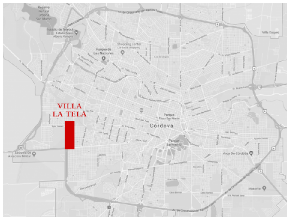
Figura 1 – Mapa de villa La Tela y barrios aledaños dentro de la ciudad de Córdoba

alguna publicación para revisarlas juntos y a menudo ellas se sorprendían de que me acordara “de tal o cual relato, de tal o cual expresión”.