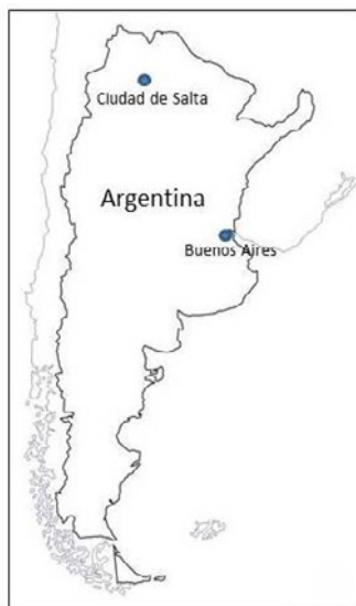
Figura 1 LOCALIZACIÓN DE LA CIUDAD DE SALTA EN LA ARGENTINA

Las formas que tomaron las iniciativas en materia de política turística (y también patrimonial) de la provincia de Salta hablan de una clara apropiación de este discurso vigente que desde varios ámbitos (fundamentalmente desde el académico y el de la gestión) indica la necesidad de hacer de las ciudades lugares competitivos. En este caso particular, el status de ciudad competitiva sería procurado de la mano del turismo, una actividad con cierta tradición en toda la provincia. En efecto, como ya fue indicado en otros trabajos, la idea de hacer de Salta un destino turístico de relevancia nacional e internacional aparece como un objetivo de la política turística provincial que se desarrolló en las últimas décadas (Troncoso, 2011; Troncoso, 2013a; Troncoso, 2013b). Los dos pilares de este proceso fueron una política provincial de estímulo al turismo en un contexto en el que comenzó a incrementarse la cantidad de turistas en la Argentina y la revitalización del centro histórico de la ciudad que también constituyó una iniciativa del gobierno provincial. Impuso al turismo y transformación urbana fueron la punta de lanza de un proceso que desde comienzos de la década de 2000 tiene como protagonistas tanto al sector público como al privado.