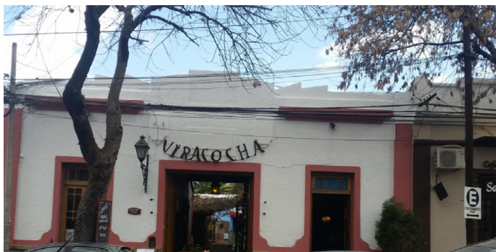
Figura 6 UNO DE LOS LOCALES GASTRONÓMICOS EN EL ÁREA DE “PALERMITO”

Los nuevos residentes, junto con los turistas (con quienes comparten preferencias de consumo; Zukin, 1995, Herzer, 2008), disfrutaron de estos nuevos espacios de ocio en un entorno patrimonial renovado: tal como lo manifestaron en entrevistas personales empresa-