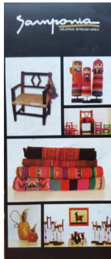
Figura 4 FOLLETO DE PROMOCIÓN DE PRODUCTOS DE DISEÑO (2011)