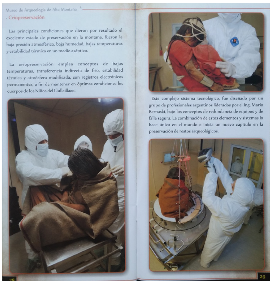
Figura 5 GUÍA DEL MUSEO DE ARQUEOLOGÍA DE ALTA MONTAÑA (2012)

El carácter cosmopolita de la ciudad, por último, se lo da la presencia de los propios turistas, especialmente los internacionales, que en las últimas décadas se hacen presentes con mayor frecuencia que antaño en varios destinos del país, incluida esta ciudad del noroeste. Así lo expresa el gobernador en el texto que inaugura una publicación oficial de turismo: “Es normal que al entrar en cualquier lugar de Salta, se escuchen voces en francés, inglés, alemán y los más variados acentos latinoamericanos. El mundo ha descubierto a Salta y nosotros, quienes nacimos y vivimos en ella, somos felices por esto” (texto firmado por el gobernador Juan Manuel Urtubey al inicio del libro Salta, tan linda que enamora ; Ministerio de Cultura y Turismo, 2012b). De esta forma los turistas son en