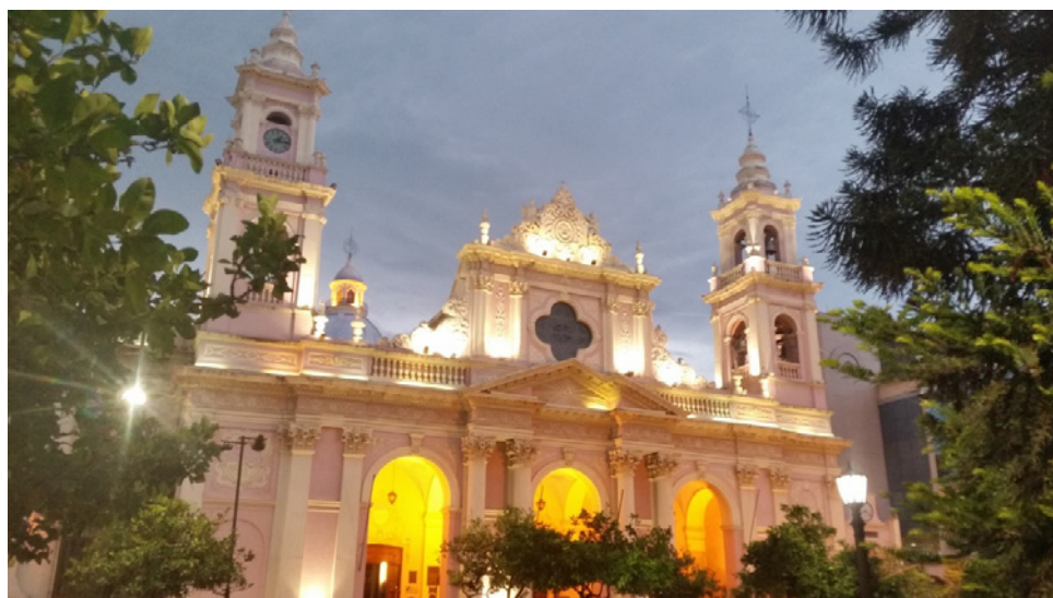
Figura 2 CATEDRAL DE LA CIUDAD DE SALTA DESPUÉS DE LAS TAREAS DE PINTURA E ILUMINACIÓN

Estas acciones, que apuntaron a recuperar el valor simbólico del centro (Herzer, 2008) que ya no era frecuentado por los sectores más privilegiados de la sociedad local, se complementan con una serie de normativas de protección que incluye la delimitación del área patrimonial 13 , y en especial con la creación en 2011 del Plan Regulador Área Centro Ciudad de Salta (PRAC) que contiene un conjunto de disposiciones que fijan criterios acerca de la apariencia y usos del centro histórico (Ministerio de Finanzas y Obras Públicas de Salta, 2011).