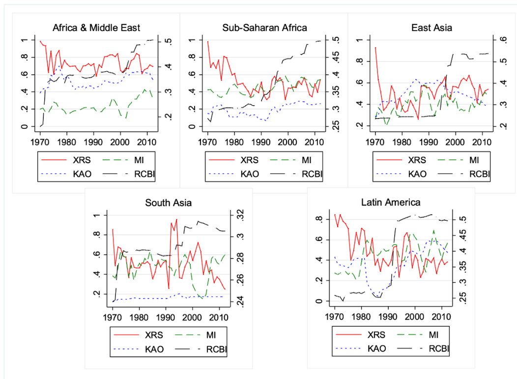
Figura No. 1. Índices de Trilemma y de Independencia del Banco Central

XRS = Estabilidad Cambiaria (izquierda), MI = Independencia