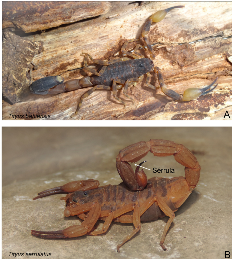
Fig. 1. A- Tityus bahiensis , vista dorsal, ejemplar vivo. B- Tityus serrulatus , vista dorso-lateral, ejemplar vivo.

de Oro Verde [31°49'26,97''S; 60°31'08,30''O], entre Paraná y Diamante, en la provincia de Entre Ríos; otro correspondiente a un ejemplar en la localidad de Lanús [34°41'57,82''S; 58°23'31,61''O] en el Conurbano bonaerense, y finalmente el más meridional correspondiente a un registro de la ciudad de San Clemente [36°22'07,87''S; 56°43'06,57''O], en la costa atlántica de la provincia de Buenos Aires (Fig. 2).