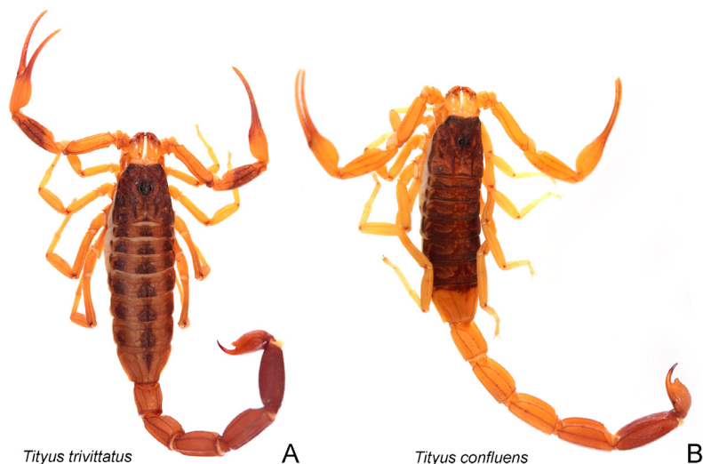
Fig. 3. A- Tityus trivittatus , vista dorsal, ejemplar fijado. B- Tityus confluens , vista dorsal, ejemplar fijado.

especies de escorpiones locales potencialmente sinantrópicas como T. confluens en el oeste y noroeste argentino, y T. bahiensis en el noreste del país. Tityus trivittatus es la única especie de escorpión en Argentina que se ha comprobado que es partenogenética (Toscano Gadea, 2004), y todas las poblaciones sinantrópicas del centro y oeste del país lo son (Adilardi et al. , 2014). Es muy probable que el éxito de esta especie como invasora esté en gran medida apoyado por su capacidad de reproducirse asexualmente, ya que esto le brinda grandes ventajas para colonizar nuevos ambientes con la llegada de uno o muy pocos ejemplares.