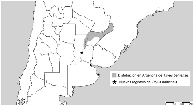
Fig. 2. Distribución en Argentina de Tityus bahiensis (grisado), y nuevos registros para la Argentina mencionados en este trabajo (estrellas negras).

fue encontrado vivo en enero del 2019 dentro de un camión cargado con carbón de leña de la zona del Chaco (sin localidad precisa), y luego remitido a los guardaparques del Parque Nacional Campos del Tuyú para su identificación. De este ejemplar hemos recibido los datos y las fotos remitidas por personal del Parque. Este es el primer caso donde se corroboró la llegada de escorpiones desde áreas naturales del norte argentino a localidades urbanas de la zona central del país, transportados pasivamente por el hombre junto con mercaderías.