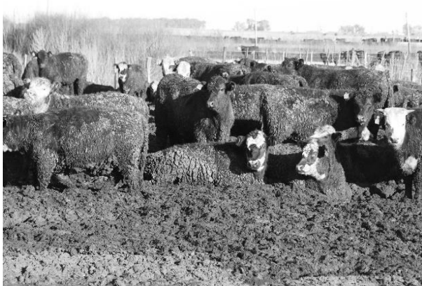
Foto 1. Presencia de barro en corrales de engorde.