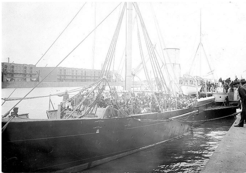
Buque de guerra Maipú transportando detenidos, 1905