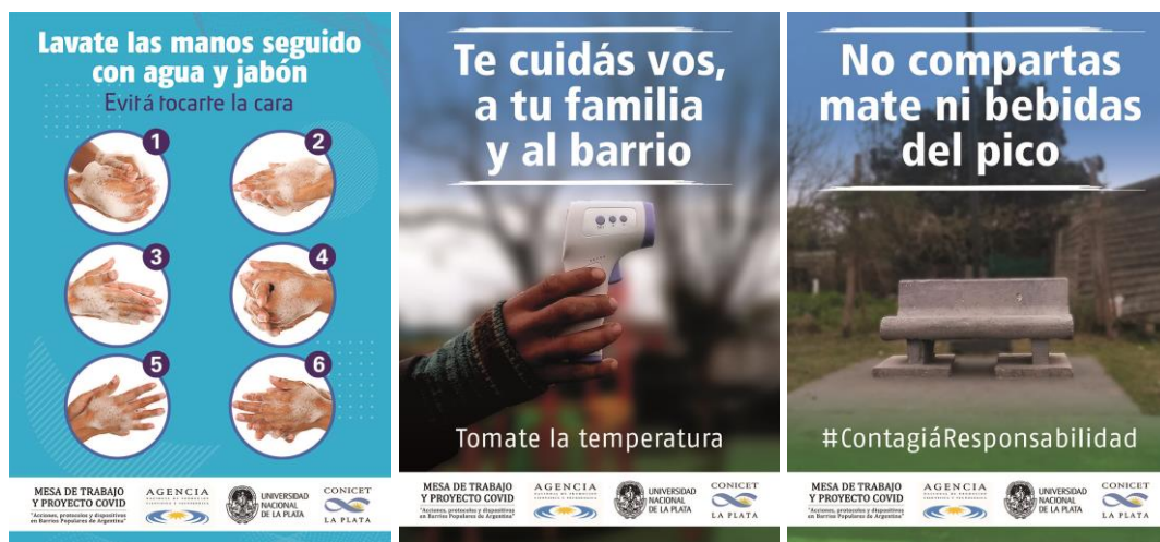
Figura 3. Serie de afiches impresos y pegados en el barrio al inicio del proyecto. Elaboración propia: Proyecto IP 763 COVID-19, MINCyT.

destinatarios en los meses siguientes. Las primeras tres temáticas de la serie sobre el autocuidado atravesado por el compromiso y la solidaridad fueron: a) en la casa: lavado de manos; b) en las organizaciones: sobre el compromiso de cuidarnos y cuidar al otro y tomarse la temperatura (en especial por la compra y entrega de termómetros pistola para el barrio y ante la reticencia de algunos a controlarse la fiebre, y c) en los espacios públicos: no compartir mate ni bebidas del pico.