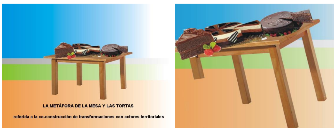
Figura 2. La metáfora de la IT latinoamericana. Izquierda: IT; derecha: Desinteligencia Territorial e Injusticia Territorial. Tres patas: pilares de la regulación: Estado, mercado, comunidad (Max Weber); cuarta pata: ciencia transformadora y educación popular; tabla: el ambiente; tortas: cada uno de los proyectos; y colores, las cuatro perspectivas: sujeto, objeto, métodos/técnicas y sueños/proyecciones.

Las ACP, además de ordenar, organizar y establecer prioridades, son pensadas y concebidas para luego ejecutar decisiones mediante micro, meso y macro-acciones, siempre con diversos e inciertos grados de dificultad en su concreción. Son concretas y hasta crudas, y no están exentas de conflictos en su siempre incierto fluir. Determinan propósitos emergentes de diagnósticos participativos en situaciones sobre las que se pretende impactar, estableciendo acciones para alcanzar una situación que se aproxime a escenarios deseados.