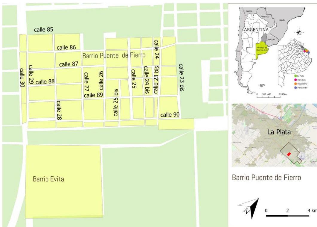
Figura 1. Barrio Puente de Fierro (Altos de San Lorenzo, La Plata, Buenos Aires). Fuente: Elaboración propia IP 763 MINCyT con herramienta QGIS (Rodríguez Tarducci, 2020)