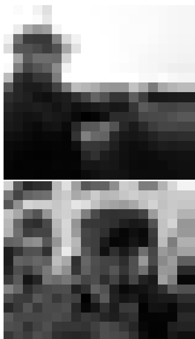
Figuras 2 y 3: recorridos sensoriales (2017).

La primera visita al edificio buscó una experiencia visual o alfabetismo visual (Mirzoeff, 2016; Mitchell, 1994) desde la implementación de la percepción háptica (Dosio, 2006; Arnheim, 1990) a partir de la asistencia de modalidades sensoriales cinestésica y táctil, a través del uso de maquetas, sonidos, recorridos, etc.