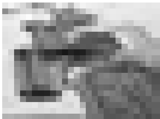
Figuras 1: maqueta háptica de la fachada utilizada en la primera experiencia de recorrido vivencial (2017).

Puesto que mirar es un acto voluntario, solamente vemos aquello que miramos, "(...) lo que vemos queda a nuestro alcance" (Berger, 2005, p.15). Tocar, oler y oír algo es también otra posibilidad de mirar y percibir nuestra realidad, de situarse y de construir una relación con ello. En la actualidad, conocer es tener acceso a las representaciones, en donde la sobrestimulación continua nos engecece las presentaciones de las cosas. Se ansían vivencias y estímulos con los que, sin embargo, "(...) uno se queda siempre igual a sí mismo" (Han, 2017, p.12). La experiencia contemporánea busca ver, oír, tocar o leer imágenes que nos remiten a lo que representan, y no ver, oír o tocar las cosas mismas como realmente son (Zamora Águila, 2015); a lo que se puede replantear la necesidad de una posible pedagogía del mirar que busque "(...) una profunda y contemplativa atención y exploración" (Han, 2015, p.53).