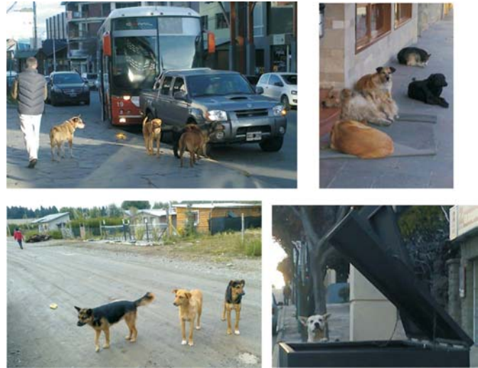
Figura 1. Perros en diferentes situaciones de vagabundeo en Bariloche (Río Negro, Patagonia, Argentina).

Se seleccionaron 5 barrios dentro del ejido municipal teniendo en cuenta el Índice NBI (necesidades básicas insatisfechas) que considera entre otras características, nivel de instrucción, déficit habitacional y cobertura de salud y de servicios 22,24 .