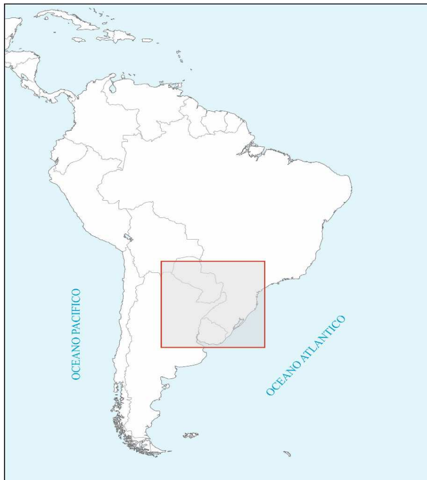
Mapa 1: Región Histórica del Nordeste rioplatense.

Consideramos pertinente mencionar el concepto de región que tomamos de referencia para identificar la vinculación Corrientes (Argentina) -Asunción (Paraguay), una idea de región que estuvo presente desde las primeras fundaciones en el siglo XVI y que implicó un nexo indiscutible desde aquellos tiempos entre ambas. En vísperas del proceso emancipador las realidades políticas, se diferenciaron y se desencadenaron de manera diferente. Esta idea de región que conecta el nordeste de Argentina con Paraguay, sur de Brasil, parte de Bolivia, Uruguay, nos vincula también a la idea de región de los antiguos 30 pueblos jesuíticos-guaraníes, la Provincia Jesuítica del Paraguay vigente desde mediados del siglo XVII hasta el momento de la Expulsión de los jesuitas en 1767.