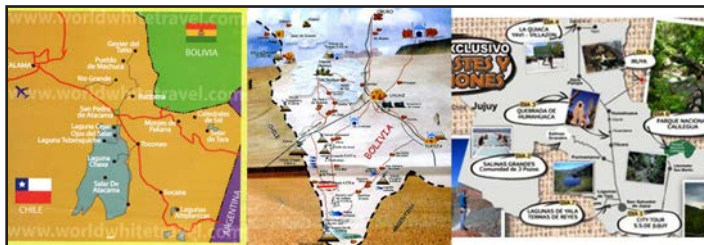
Figura 3. Cartografías comerciales locales que repiten los patrones estatales.