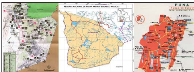
Figura 2. Cartografías estatales subnacionales que comprenden una región turística particular.

Fuente: Servicio Nacional de Áreas Protegidas de Bolivia (s/f); Servicio Nacional de Turismo de Chile (s/f-b); Secretaría de Turismo de Jujuy (s/f).