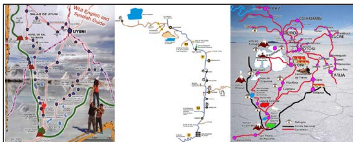
Figura 5. Cartografías comerciales locales desprendidas de su entorno.