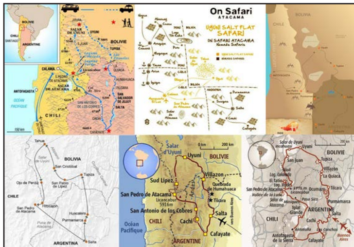
Figura 6. Cartografías comerciales extra-regionales.