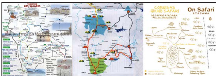
Figura 4. Cartografías comerciales locales con superficies homogéneas y diferenciación limitrofe.