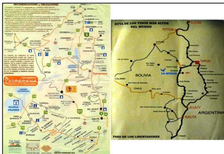
Figura 8. Cartografías estatales locales.