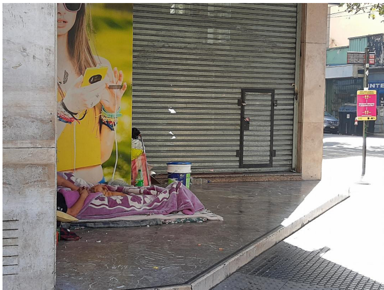
Imagen 1. Fotografía tomada en un barrio céntrico de la ciudad. Abril de 2020.