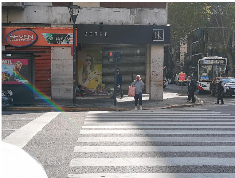
Imagen 2. Fotografía tomada en un barrio céntrico de la ciudad. Abril de 2020.