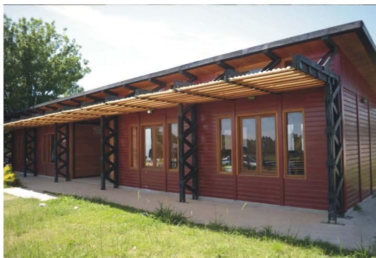
Figura 4: Fotografía del SUM.

Asimismo, la elección de un recurso natural renovable como la madera de Eucalyptus para la construcción de viviendas implicó explorar provechosamente varias dimensiones del problema: en términos ambientales se estaba utilizando un recurso maderero de bosque implantado de crecimiento rápido, que al ser seleccionado como material para la construcción contaba con significativas ventajas comparativas en relación con otros materiales de construcción: