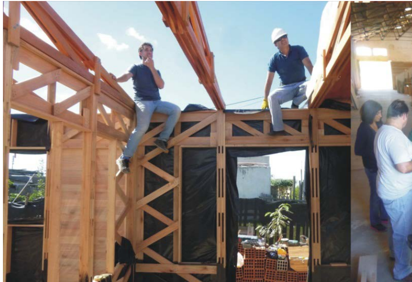
Figura 7: Reuniones interactorales en la municipalidad de Concordia.