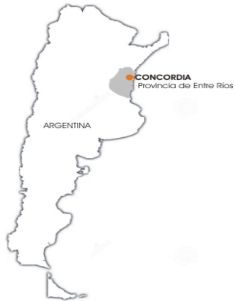
Figura 1: Ubicación geográfica de la ciudad de Concordia.

viviendas, entre otros) poniendo en valor desde sus inicios la matriz productiva local (ver figura 2). La experiencia se inició en el año 2010 y continúa vigente.