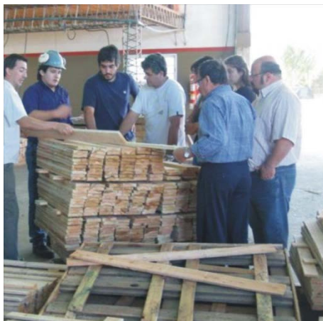
Figura 3: Fotografía Recorrido por Aserraderos locales.