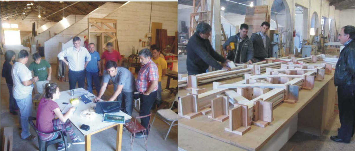
Figura 5: Fotografías de los Encuentros Productivos: Fuente: proyectos de investigación financiados por la Agencia Nacional de Promoción Científica y Tecnológica (ANPCYT)