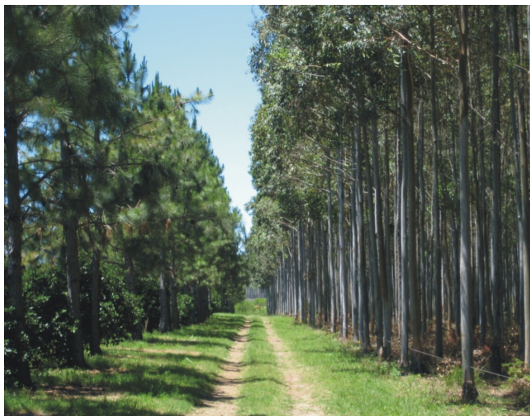
Figura 2: Matriz productiva local. Recurso forestal Eucalyptus Grandis.