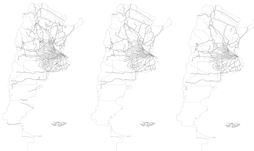
Figura 1. Longitud de la red ferroviaria argentina en 1957 (izq.), 1980 (centro) y 1998 (der.).

momento de su máxima extensión y en 1957 la longitud era de 43.936 kilómetros, 1.468 más que en 1945 (Cuadro 1 y Figuras 1 y 2). En gran parte esto se debe al ferrocarril de Huaytiquina, que conectó a Salta con Antofagasta (Chile) a través del paso de Socompa, inaugurado en 1948 (Benedetti, 2005).