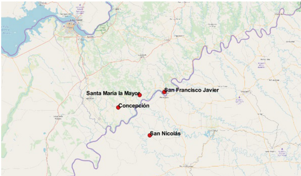
Figura 2. Ubicación de las reducciones de San Francisco Javier, Santa María la Mayor, Concepción y San Nicolás en el marco de un mapa actual.

Ahora bien, si esto es así, ¿por qué José Coco manifiesta conocimiento de las especificidades lingüísticas de Santa María la Mayor? Aunque no debería rechazarse la posibilidad de que hubiera estado asignado a esta última reducción entre 1681 y 1686, existen también explicaciones alternativas. En primer lugar, como se observa en la Figura 2, San Francisco Javier y Santa María la Mayor son pueblos muy cercanos, únicamente separados por 20 kilómetros. No resulta improbable que por razones operativas conociese la especificidad lingüística de este territorio. En segundo lugar, no era algo fuera de lo común que los misioneros realizaran algunas actividades en pueblos vecinos. Un libro de preceptos de las reducciones de guaraníes —que contiene las normas que seguían los jesuitas— indica que los misioneros debían mudarse a un pueblo vecino para la realización de los ejercicios espirituales 33 . Por su parte, en 1747 José Cardiel 34 explicó en su relación