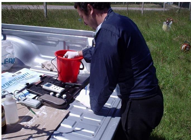
Figura 7: Medición de los parámetros físicos en el campo.