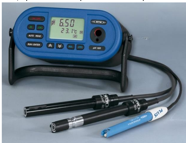
Figura 5. Conductímetro, aparato de campo o laboratorio para medir conductividad eléctrica

Color: en general, las aguas subterráneas no poseen color, pero en el caso de poseerlo, es el resultado de las sustancias disueltas en agua, material particulado en suspensión o contaminación antrópica.