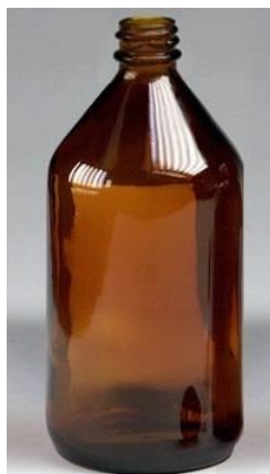
Figura 8. Botella utilizada el muestreo para determinación de agroquímicos.