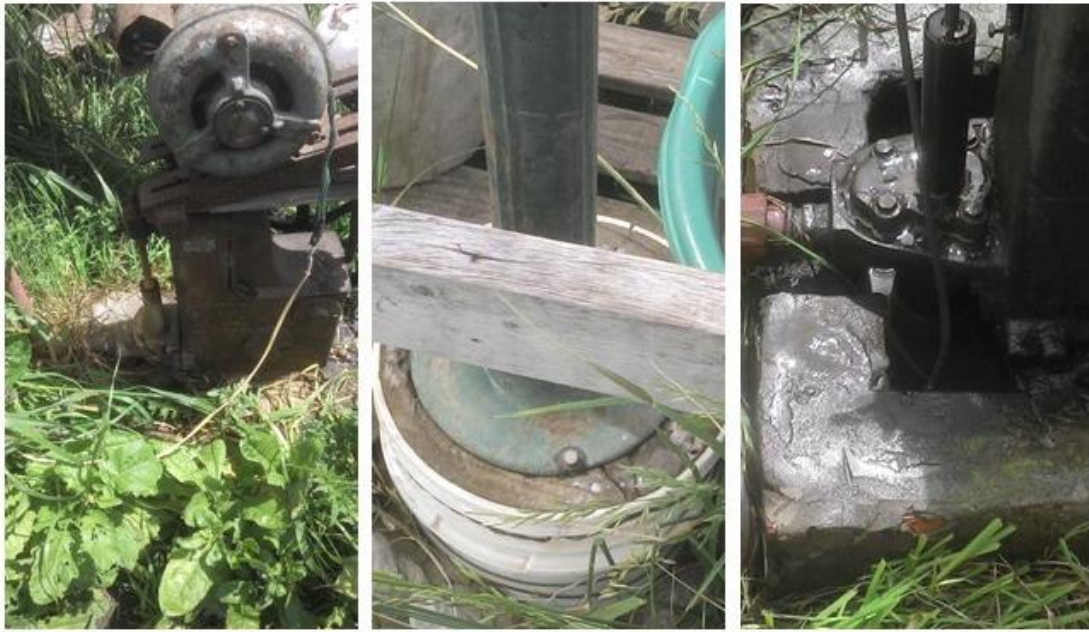
Figura 9. Ejemplos de deficiencias constructivas que favorecen el ingreso de posibles contaminantes al pozo.

aislación de la boca de pozo de manera de no permitir ninguna filtración de agua de la superficie en el espacio anular (Figura 9).