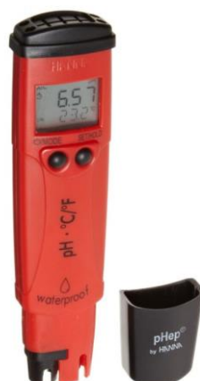
Figura 6. pHmetro de campo